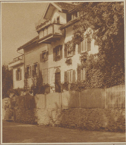
Wo Pfarrer Künzle wohnt