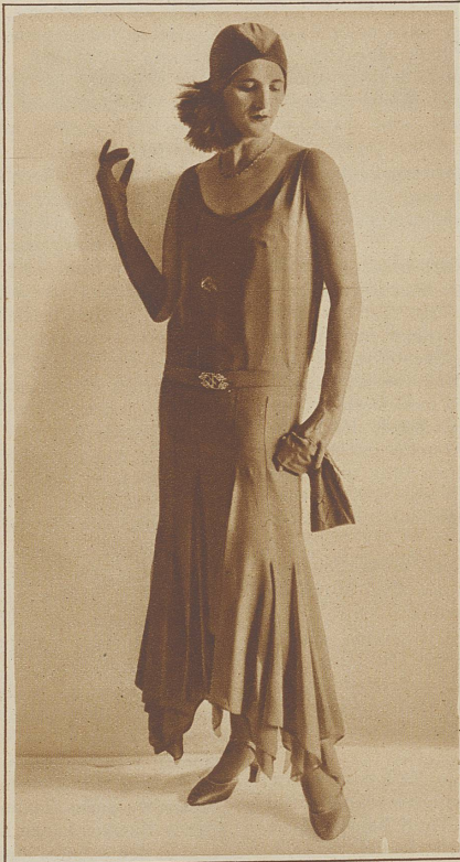
Der «neue Stil», sehr schlank fallende, lange Robe in Crêpe Josette; Samt-Toque mit Reiter, mit Nervüren verzierte lange Handschuhe und Satinschuhe im gleichen rotviolettten Dahlblau. (Grieder-Doelker)

in der Form natürlich dem Nachmittagskleid angepaßt. Dann sieht man Ensembles mit dreiviertel Jacken, und die neuen Hüte, ach, einfach ideal! Ob Du sie allerdings tragen kannst? Weißt Du, ganz aus der Stirn, der Rand hauptsächlich seitwärts und nach hinten: etwas nach Intelligenz! Schöne Augen kommen da gut zur Geltung. (Ich werde immer stiller.) Auch Turban und Burnuß in Samt, aber sonst bleibt's bei Filz, Filz in allen Variationen. Das beige ist nun dunkelbraun geworden, überhaupt schöne bestimmte Töne. Bei Mänteln und Hüten: rouge, chocolat, capuzine und grün! Danke Dir, richtiges Grün. Abends sind Dir punkto Idee gar keine Schranken gesetzt. Das zipfelt, schleppt, fließt, glockt, fliegt in tausend Variationen. - - - Ich staune