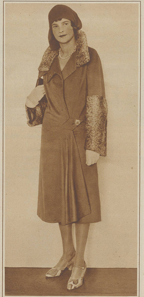
Flaschengrüner Duvetine-Mantel mit Natur-Perstaner; Nachmittagschuh in Pitheon-Haut (Grieder-Doelker).

Klar ist das Grieder'sche Bekenntnis, nach vollendeter Rutschpartie des Gürtels wieder bei der normalen Taille angelangt zu sein. Offensichtlich ist das Einsetzen für Verlängerung, sofern Kleider nicht für Alltag und Straße bestimmt sind. Geschickt aber wird der Eindruck des Ueberganglosen und des Zwanges vermieden. Wohl ist dem neuen Kostüm die Bluse unterzogen. Wohl charakterisiert x -mal die weiche Linie gleichmäßigen