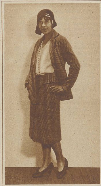
Modell Montreux Knitting House: Damenkostüm in schwarz-weiß diagonal-gestreiftem Trikot.