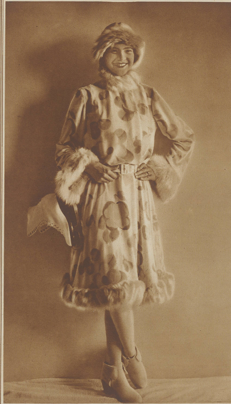
Grieder-Eislaufkostüm «Sonne von St. Moritz», Velours Chiffons, mit pastellfarbenen Blumen bedruckt. Weiße Schneeschuhe und Schlittschuhstiefel in weißem Chevreau.

in der Mode – diesmal gilt's. Darüber war sich klar, wer im Baur au Lac Zeuge der Grieder-Doelker-Modeschau war. Elegante Mannequins demonstrierten ungezählte Möglichkeiten, zur eigenen und zu des Partners Unterhaltung, wenigstens äußerlich eine andere zu werden, sich von Kopf bis Fuß anders als seit langen Jahren zu kleiden. Daß neue Eleganz sich bis zu den Fingerspitzen, und mit dem wieder hervorgeholten langen Handschuh zum ärmellosen Kleid sich über den Ellbogen erstreckt, bewies die an dieser Modepartie beteiligte Handschuh-Firma Wießner.