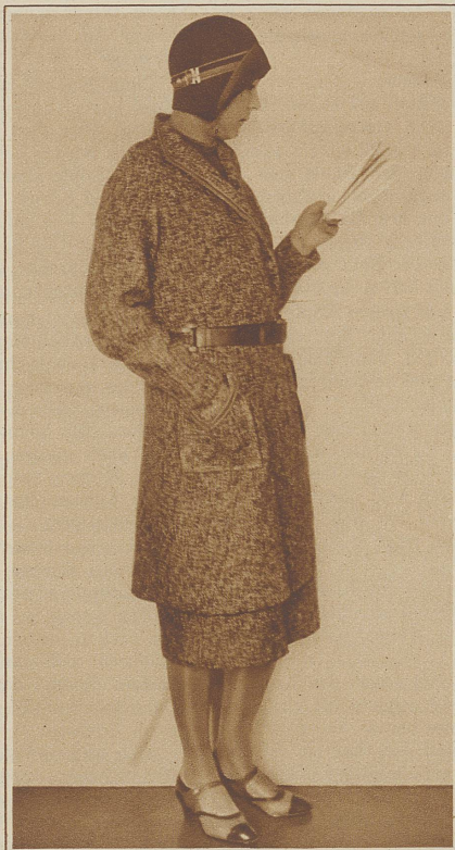
Praktisches Winterkostüm in gelblichbraunem Tweed, am hochsitzenden Ledergürtel und am Hutband Holzmoitve. Trotteur in braunem Chevreau u. Boxcall (Grieder-Doelker).

«Blousons» die neue Taille, wohl wirft sich - hinter den Kulissen verstohlen an der Seite zugehakt - die Robe wieder ein wenig in die Brust - aber durchdrungen von Aktualität tragen Modehuldinnen auch Mäntel, zwar in lauter neuen Stoffen, aber die Wandlung von der «Geraden» zur ausladenden Prinzessform in feinen Zwischentypen demonstrierend. Sie tragen Kleider, die mit betontem Glockenschnitt in steifer Seide raffinierte Ausnahme bilden von der Regel, daß «alles fließ» d. h. schlank an der Frau herabgleitet, um erst in tiefer Region charmant und ungezwungen zu «spielen». Soviel ausgetüftelter schneiderischer Mittel die Mode sich dabei bedient, immer ist das Prinzip erkenntlich: Hüften schlank zu umfassen! Haben wohl die Mannequins die Seufzer zu ihren Füßen vernommen? Seufzer nicht etwa nur huldiger Kavaliere, sondern grausam aus ihrem «vollschlanken» Traum auf-