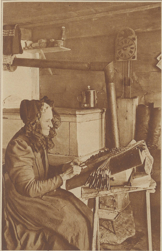
Klöpplerin aus Lauterbrunnen