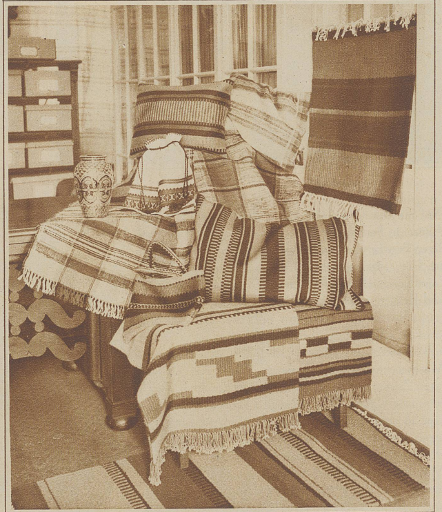
Handgewobene Haslitaler Stoffe