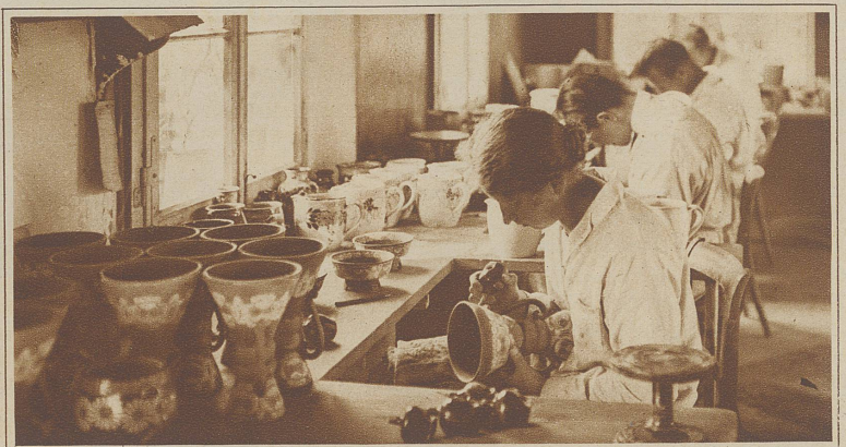
Die Produkte der Töpferei werden von Hand bemalt