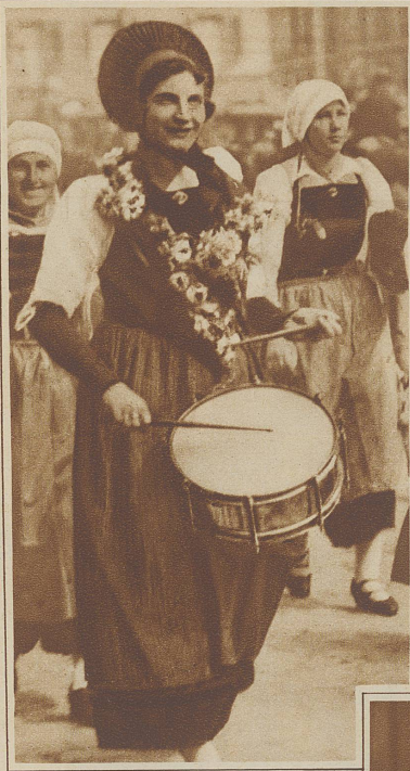
Träm, Träm, Trä - deri - dri — — —

Gebilde in den Brand kommen. Unablässig wird hier gearbeitet.