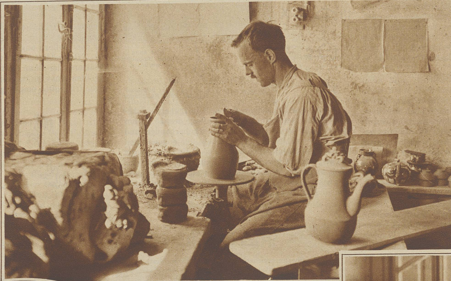
Nebstehend: Stefflbürger Kunsttöpferei Formen der Töpfe aus Leimklötzen

Klöppel und Filetstäbchen verstehen jung und alt zierliche, duftig und luftig wirkende Muster zu schaffen, die das Entzücken und Begehren aller Sachverständigen erweckt. So fein auch die „mechanische“ Spitze geschaffen ist — mit der Feinheit der handgearbeiteten, dem unter besonderer Sorgfalt entstandenen Einzelwerk einer geübten Hand, kann sie es nicht aufnehmen. Die Filet- und Klöppelarbeiten der Berner Oberländerinnen haben deshalb auch Weltruf.