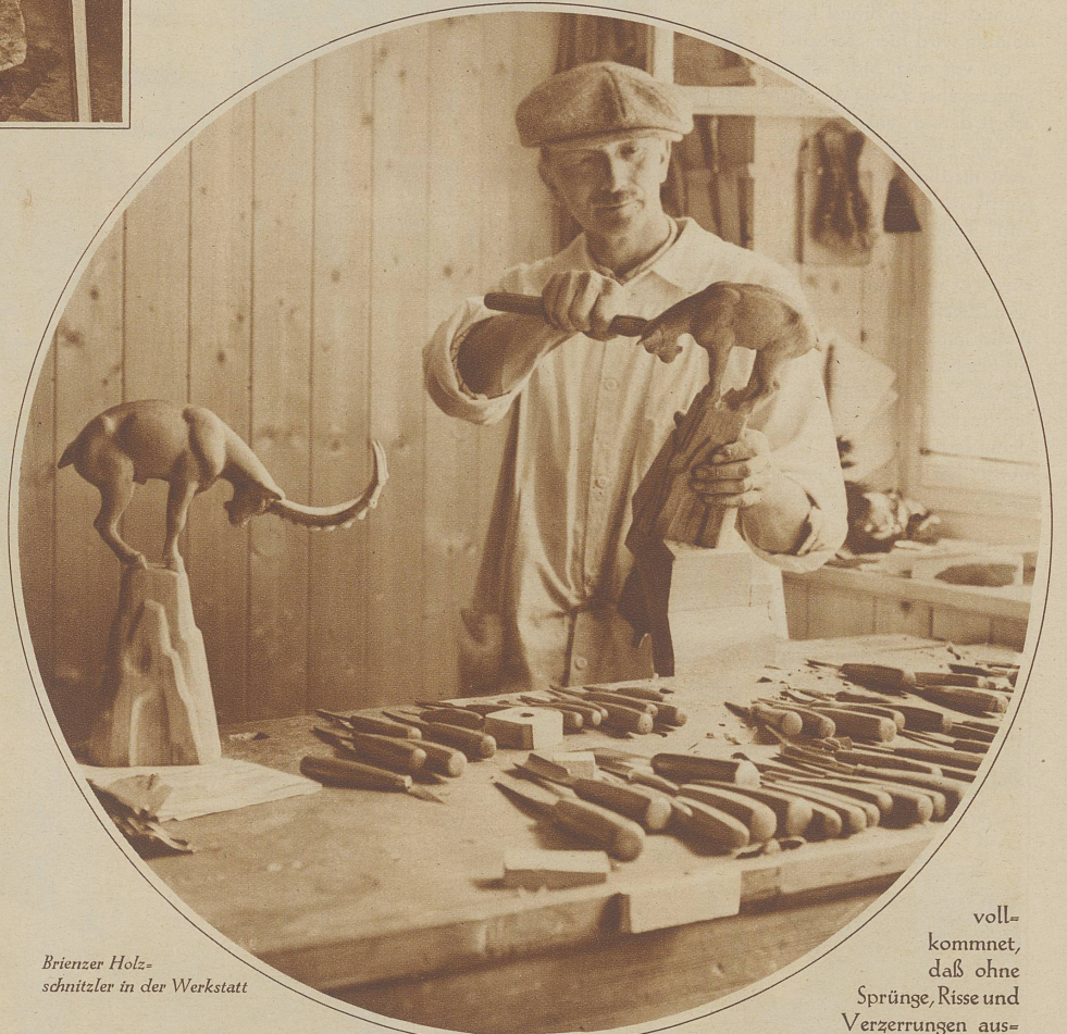
Brienzer Holzschnitzler in der Werkstatt

Auf meinen Reisen traf ich in Tunis sowohl, als in Algier, in Berlin, wie in Stockholm solche Arbeiten, deren Besitzer mit Stolz darauf hinwiesen. Eine Eigenart liegt schon darin, daß sie nach wohlgehüteten Familienschätzen zu Decken und Behängen, zu Kissen und Kragen gearbeitet werden. Wenn solche Decken beispielsweise auf einem gut polierten Tische liegen, so ist jede Unterlage überflüssig. Auf hellem Birkenholz wirken die Muster besonders schön, wenn Maschen und Linien in ihrem ganzen künstlerischen Zusammenklang zur Geltung kommen. Die heimische Kunst, nicht technische Fertigkeit allein, liegt in solchen Oberländer Handarbeiten. Und wenn wir ganz weit zurückblicken wollen, so entwickelte sich diese Frauenarbeit aus dem derben Männerhandwerk des Knüpfens von Fischnetzen und dergleichen. Später förderten die Klöster diese Art, und recht mühsame Arbeit brachte die heutige Technik und Fertigkeit darin zustande.