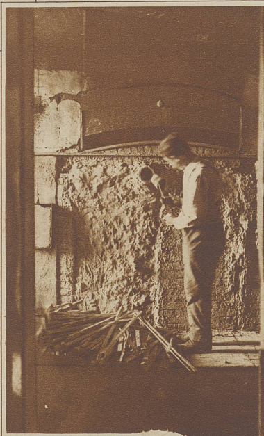
Brennofen einer Steftisburger Töpferei