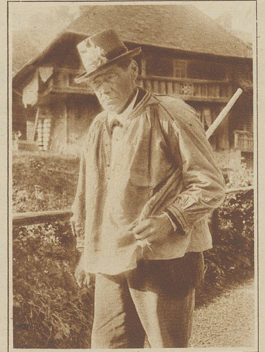
Typischer Oberländerbauer im Burgunderhemd

Zuerst habe ich mich einmal umgesehen, was die Frauen und Töchter des Oberlandes treiben. Sehr natürlich — immer „Ladys first!“ Ihre Handkunstarbeit besteht in Klöppel- und Filetherstellung. In den Tälern der Lüttschinen, Lauterbrunnen und Grindelwald werden die herrlichsten Spitzen hergestellt. Auch