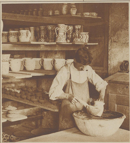
Glazieren der Gefäße