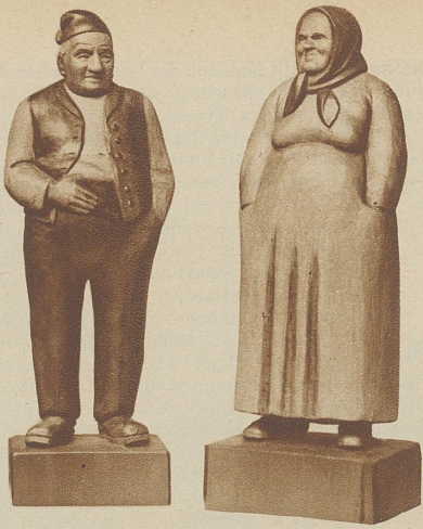
Ein urchiges Oberländerpaar. Briener Holzschnitzerei.

Als ich auf der Suche nach Bodenständigkeit und Heimatkunst in Gegenden des Oberlandes kam, erkannte ich staunend, daß ja eigentlich die bäuerliche Kunst das Problem, innerhalb der ästhetischen Grundsätze die höchste Zweckmäßigkeit zu erreichen, längst gelöst hatte. Nicht nur die kleinen, sonnegebräunten Häuschen, sondern alles, was diese freundlichen Menschen umgibt, was von ihnen erzeugt und benutzt wird, ja sie selbst und mit ihnen ihr ganzes Leben, ihre Sitten und Bräuche sind nach einer einheitlichen Aesthetik abgestimmt. In allem liegt eigener Stil und gute Tradition. Das Leben des Berner Oberländers vollzieht sich im Rahmen des Väterherkommens, er lebt sein Leben nicht als einzelne Person, sondern als Glied einer Kette von Geschlechtern. Er erstrebt nicht den Individualismus, sondern sucht das Erbe seiner Väter auch seinen Nachkommen zu übermitteln. Damit wird er selbst und werden seine heimatischen