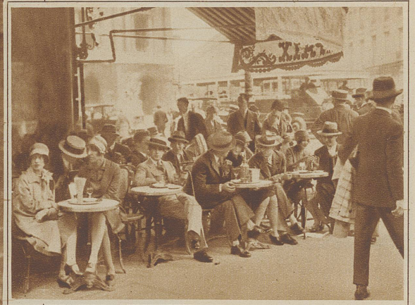
Das Café auf der Straße. Wer in Paris war, schwärmt davon

Auf dem Montparnasse setzen echte Kunstzigeuner, ein stets zu Scherzen aufgelegtes Künstlervölkchen die ruhmreichen Traditionen des Montmartre fort. Man ist aus dem alten Elendsquartier des Montmartre, über dem zwar immer noch unsichtbar der Geist eines Henri Murger schwebt, oder die köstlichen Melodien von Puccinis weltberühmter Oper Bohème kosen, in das moderne, lichtdurchflutete Quartier des Montparnasse übergesiedelt, womit eigentlich das