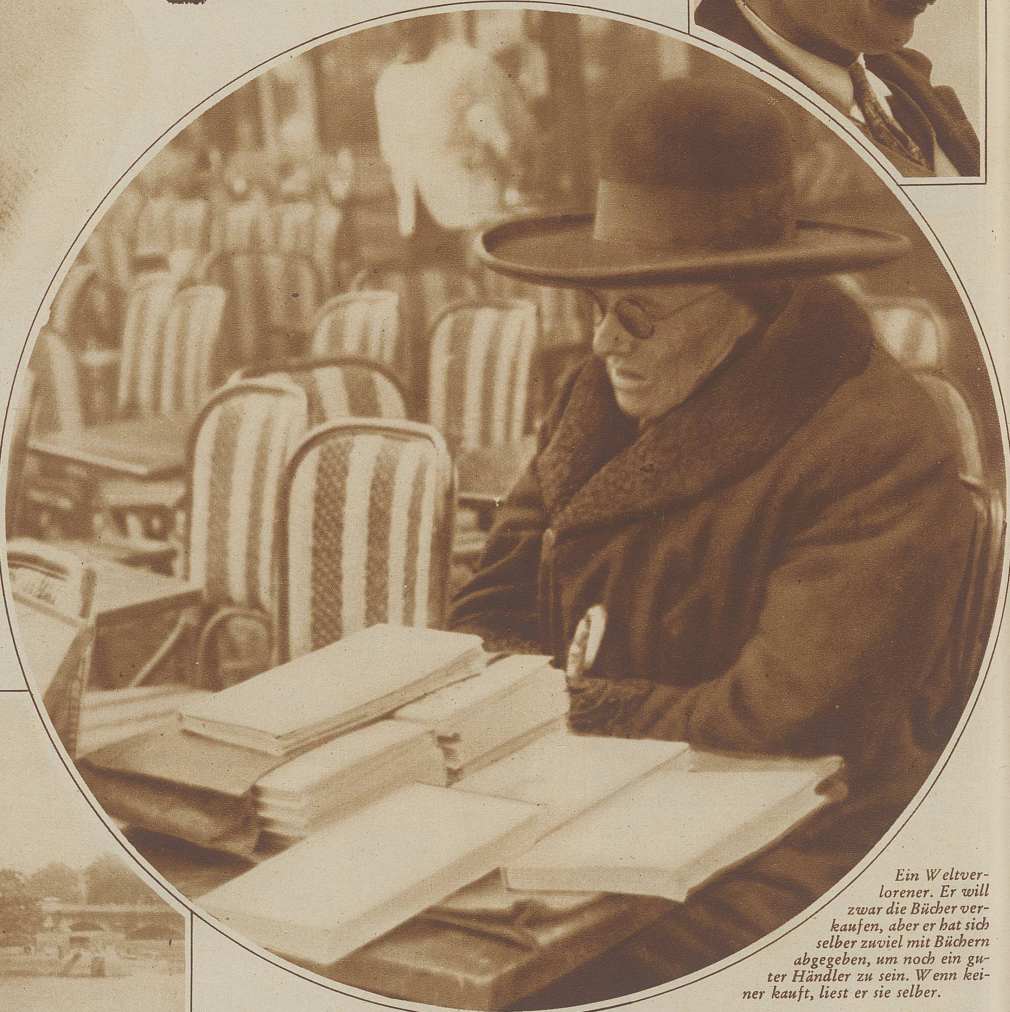
Ein Weltverlorener. Er will zwar die Bücher verkaufen, aber er hat sich selber zuviel mit Büchern abgegeben, um noch ein guter Händler zu sein. Wenn keiner kauft, liest er sie selber.

Bild unten: Der Maler an der Seine ist nicht immer ein großer Künstler, aber er trägt in jedem Falle zur Unterhaltung und Belebung der Stadt bei und wird drum hoffentlich noch lange bleiben.