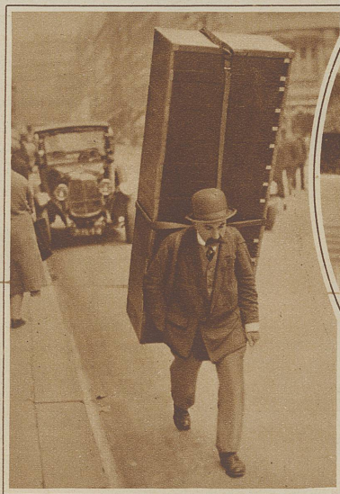
Ein ganz und gar pariserisches Erzeugnis von unbestrittener Wichtigkeit: Der Musterkofferträger

unterzutauchen. Markante, von Welt- ruhm blendend umstrahlte Köpfe geben sich lustig und gesellig ihr Stelldichein, so der reklametüchtige japanische Maler Foujita, der immer wieder die Oeffentlichkeit zu beschäftigen weiß, oder der holländische Salonlöwe Kees van Dongen, der Maler der vornehmen Gesellschaft. Aller Muse aber, der lebende Stern des Montparnasse, ist nicht die liebliche Mimi von einst, sondern Kiki, ehemals Modell, dann Malerin, dann kecke Schriftstellerin. Sie läßt sich nicht „bedichten“, wohl aber umschwärmen, feiern, in den Mittelpunkt stellen. Sie schreibt ihre eigenen Memoiren und wird selbständige Nutznieferin ihres Ruhmes. Denn Ruhm ist heute eine in