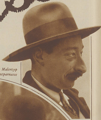
Noch ein Malertyp von Montparnasse

Wer in Paris war, ohne einmal die zahlreichen Künstlerlokale und Kabarette des Montparnasse durchzummelt zu haben, der kennt nicht die Herrlichkeiten dieser schönen und bunten Stadt. Aller englisch-amerikanischen Invasion zum Trotz hat sich ein Stück echter Pariser Tradition hierhin retten und flüchten können. Hier gibt sich der Pariser natürlich und echt, eben rein pariserisch liebenswert, hier ist man ungezwungen heiter, ganz unter sich und huldigt lächelnd den Frauen und den feinen Künsten.