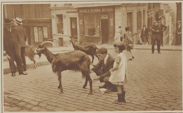
Ziegenmilch frisch vom Faß, Seitab von den glänzenden Straßen und rasenden Autos finden wir sie noch ab und zu, diese idyllischen Szenen in einer Weltstadt. Wie lange noch?