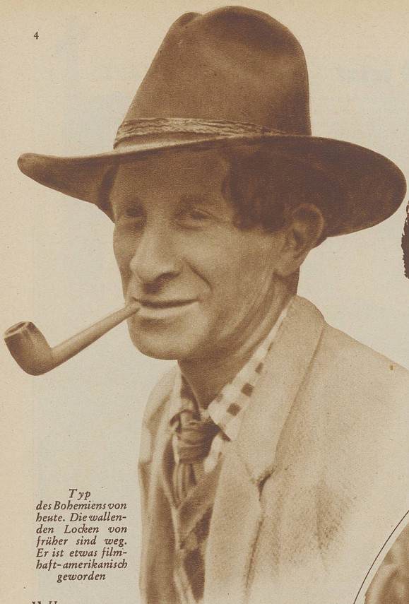
Typ des Bohemiens von heute. Die wallenden Locken von früher sind weg. Er ist etwas filmhaft-amerikanisch geworden