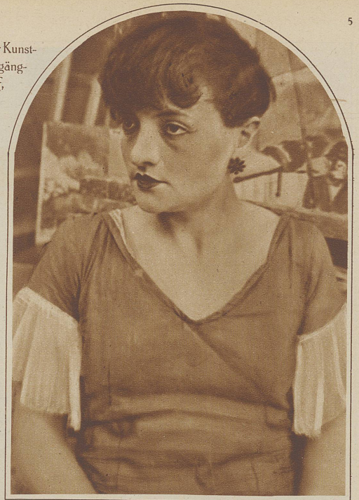
Modell von Montparnasse

Pariser Brotwagen. Eine alte Form, immerhin ist es möglich, daß er dem modernen Kinderwagen als Vorbild gedient hat