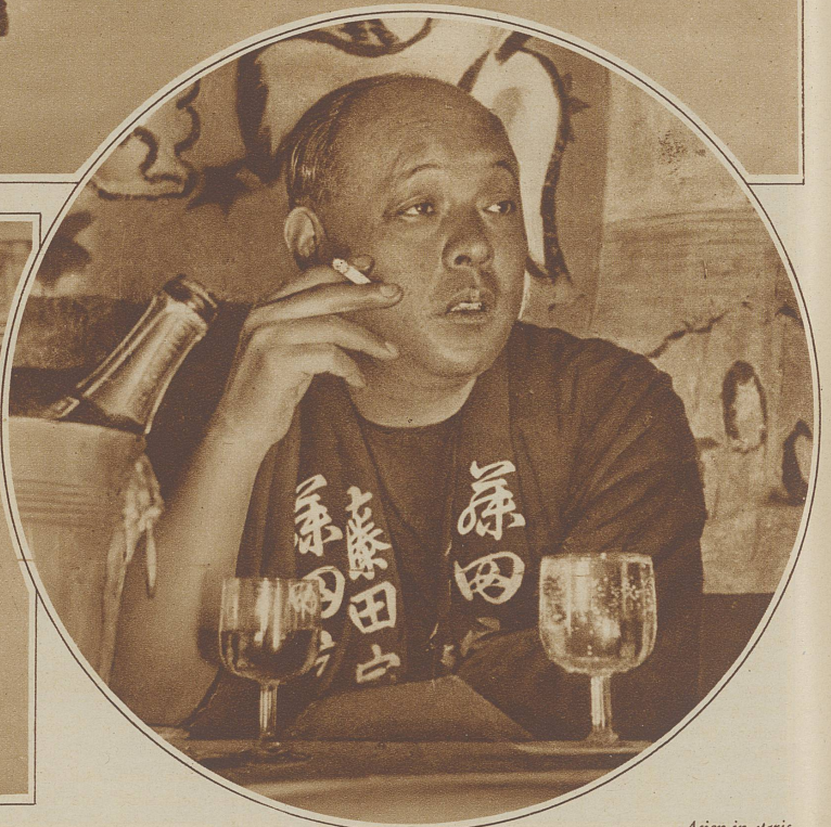
Asien in Paris