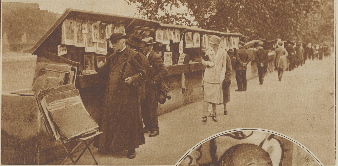
An der Seine. Bücherkasten am Pont St.-Michel

unterzutauchen. Markante, von Welt- ruhm blendend umstrahlte Köpfe geben sich lustig und gesellig ihr Stelldichein, so der reklametüchtige japanische Maler Foujita, der immer wieder die Oeffentlichkeit zu beschäftigen weiß, oder der holländische Salonlöwe Kees van Dongen, der Maler der vornehmen Gesellschaft. Aller Muse aber, der lebende Stern des Montparnasse, ist nicht die liebliche Mimi von einst, sondern Kiki, ehemals Modell, dann Malerin, dann kecke Schriftstellerin. Sie läßt sich nicht „bedichten“, wohl aber umschwärmen, feiern, in den Mittelpunkt stellen. Sie schreibt ihre eigenen Memoiren und wird selbständige Nutznieferin ihres Ruhmes. Denn Ruhm ist heute eine in