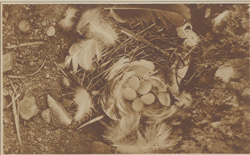
Gelege der Uferschwalbe

Will man mit den Schwalben fühlen, so sei es das Streben in die Ferne, das durch den Wandertrieb bedingt ist. Aber warum soll den Menschen die Sehnsucht packen! Zu Hause, wie in weiter Ferne, gibt es nur immer wieder eins: Sei deines Lebens zufrieden. Darum, ihr lieben Schwalben: Auf Wiedersehn!