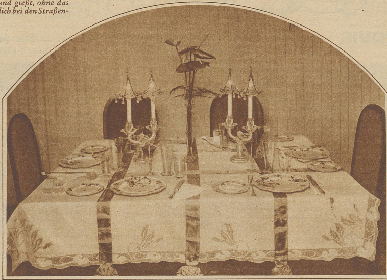
Ueber das Tischtuch gelegte, mit dem Muster des Porzellans harmonisierende farbige Seidenbänder und aparte Glasleuchter, geben dem Tisch eine persönlich wirkende, festliche Note