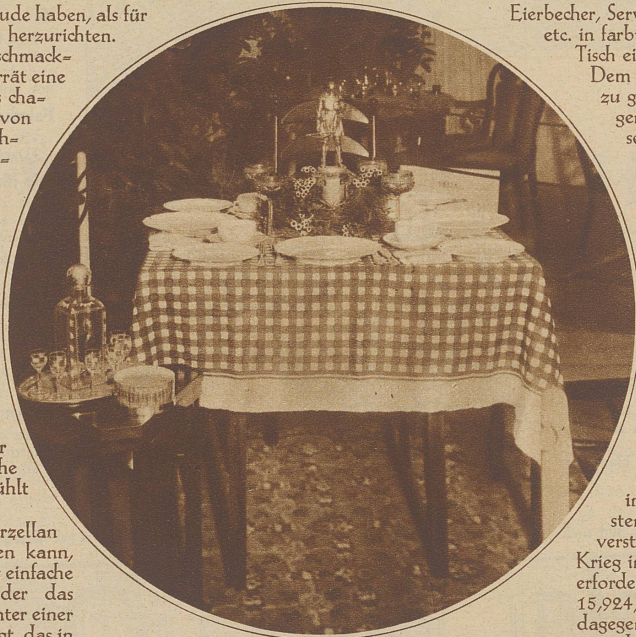
Wenn gute Bekannte zum einfachen Abendessen erwartet werden, kann der Tisch ohne großen Aufwand nett gedeckt sein

Nicht jede Hausfrau kann es sich leisten, leicht beschädigtes Geschirr sofort auszuzunehmen. Um so mehr soll täglich alles akkurat auf dem Tisch aufgestellt, Besteck und Servietten ordnungsgemäß aufgelegt sein. Notwendiges darf nicht fehlen, auf daß nicht immer Eines aufspringen muß und der Hausherr verdrießlich wird. Kinder müssen dazu erzogen werden, manierlich zu essen und Flecken im Tischtuch zu vermeiden. Bei Neuanschaffungen wähle man nach modernem Geschmack, einfach, aber ansprechend. Gegenstände, z.B. wie