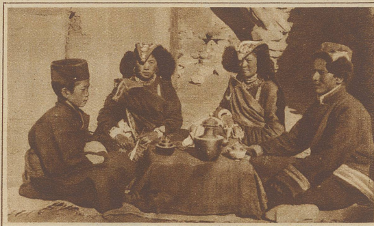
Tibetanerfamilie beim Tee