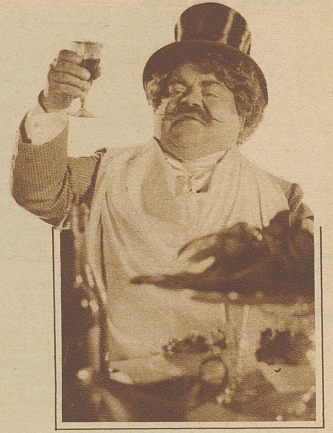
Kein Gast für den kultivierten gedeckten Tisch

Es gibt Frauen, die an nichts mehr Freude haben, als für Gäste den Tisch besonders schön herzurichten. Nicht immer aber ist dieses «schön» auch geschmackvoll. Die Art, wie wir den Tisch decken, verrät eine ganz bestimmte Kultur. Für unsere Zeit ist's charakteristisch, daß sich diese Kultur wie von einem Zuviel der Speisenfolge, auch von prahlerischer Ueberladung mit Tafelschmuck abwendet.