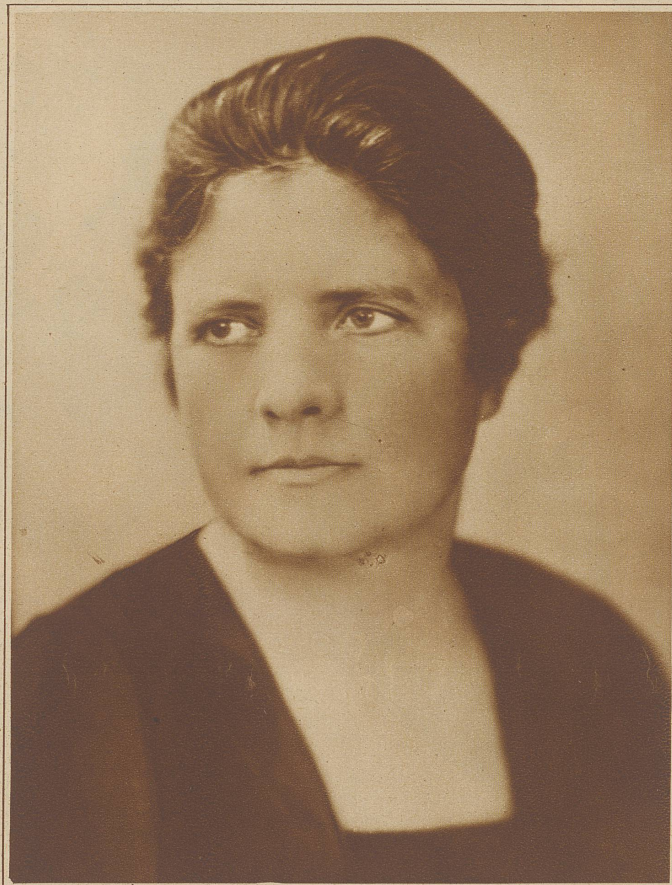
Viscountess Rhondda, Journalistin, Schriftstellerin und Großindustrielle