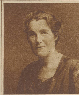
Bild links: Mrs. Corbett-Ashby Präsidentin der Internationalen Frauenvereinigung für Stimmrecht und Gleichstellung

tischen Flug von Kapstadt bis Croydon, eine Erstbefliegung dieser Strecke, die 10 000 Meilen umfaßte. Der Schriftsteller, der uns darüber berichtet, fügt ehrlich hinzu, wäre Lady Heath ein Mann, ganz England wäre zu ihren Füßen gelegen, aber die Eifersucht des Mannes ist groß in diesem Lande, und es scheint oft schwer zu sein für den Mann, die Abneigung gegen das männliche Weib zu überwinden. Warum begrüßt man Lady Heath nicht lieber als den Typus der neuen Frau, die tief im Weibtum wurzelt, hinaus- und hinaufwächst, um dem Manne Gefährtin eines wunderbar erweiterten Menschentums zu sein? — Man wird sagen, die Lady Heath sei ein vereinzelter Fall. Das ist nicht wahr. Sollte man nicht glauben, daß die Präsidentin des Weltstimmrechtsverbandes der Frauen eine Kampfnatur ersten Ranges sein müßte, mit besonders energischem, kräftigem