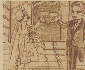
Tragen wir den Kranz der Myrthe, Wenn der große Tag erscheint Sei die Zürcher Illustrierte Hoch gelobt, die uns vereint.