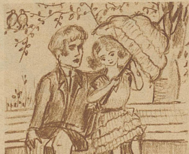
Ist die Sache dann im reinen Und das Inserat geglückt, Muß ich elegant erscheinen Daß die Männer ganz entzückt.