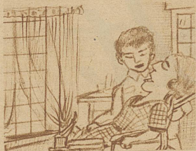
Und die Zähne ließ ich plombieren Bei dem Zahnarzt nebenan. Und die Haare hoch frisieren Beim Coiffeur «Herr Krüthenmann»