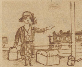
Wenn ich dann den Mann gefunden Und mein Herz im Glücke lacht, Dann sag ich auch unumwunden Meiner Herrschaft: «Gute Nacht.»