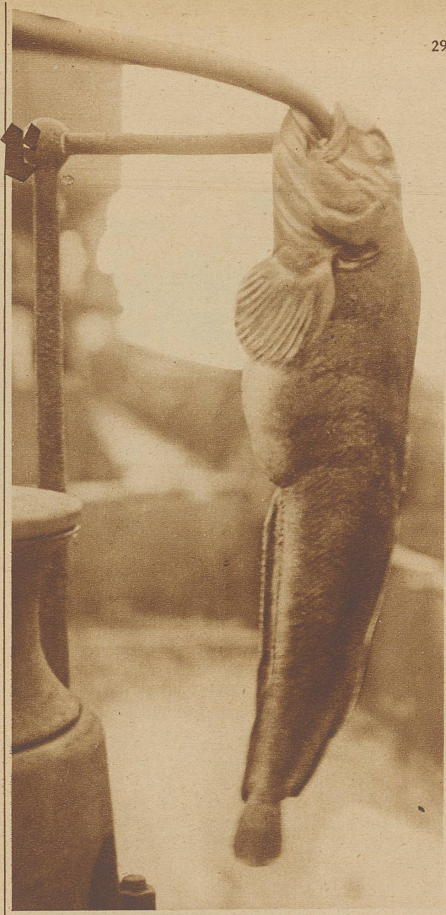
Ein Kattfisch, der über ein derartig starkes Gebiß verfügt, daß er sich an der Eisenstange festbeißt. (Das Gebiß kommt dem Fisch zustatten, da er sich ausschließlich von Muscheltieren ernährt. Der Fisch kommt unter dem Namen «Karbonadenfisch» in den Handel)

Es kommt auf den Fischreichtum an, der bestimmt, wie lange das Netz zu schleppen ist. In der Laichzeit vom Februar bis April sucht auch der Fisch in größeren Scharen seichtere Gewässer, die Küste auf; darum begann unsere Dampfwinde bereits nach vier Stunden das Netz aus der Tiefe zu holen. Ob wir viel gefangen haben? Die Spannung ist allgemein, sind doch Kapitän und Mannschaft prozentual am Fange beteiligt. Schon sind die zwei Scheerbretter an Bord, nur das Netz befindet sich noch im Wasser. Da — ein Zischen, ein Sprudeln und plötzlich schießt das Ende des Netzes wie ein riesiger Ballon aus der Tiefe. Und dieser Ballon ist gefüllt mit den köstlichsten Fischen aller Art — ein guter Fang! Freudig greift jeder in die Maschen, um das Netz zu bergen. In einer Reihe stehen sie, die ostfriesischen Hünen, in Oelzeug und Südwester. Schnige Fäuste ziehen das Netz empor und nun wird der zentnerschwere Beutel mit Hilfe der Dampfwinde an Bord gehievt. Ein Ruck am Tau und ein gleißender Strom von Fischleibern ergießt sich in die bereits erwähnten Fächer; das zuckt und