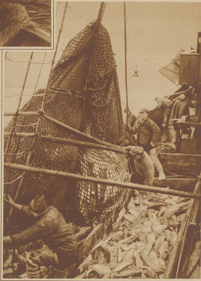
«Der große Augenblick.» Ein guter Fang — Das Netz kommt an Bord

Um drei Uhr nachts kam der Befehl, das Netz einzuholen. Schlaftrunkene Gestalten stolpern aus ihren Kojen hinaus an Deck, sich den Bewegungen des schwer arbeitenden Schiffes anpassend. Ein eisiger Nordwest benimmt den Atem. Festhalten. Die Leute rufen es sich zu, die brüllende See öffnet es ihnen nach. — Festhalten! Ein schwerer Brecher schlägt krachend an Deck, gegen die Körper, daß es schmerzt. Hol fast!! Zischend und knatternd beginnt die Dampfwinde ihre Arbeit und bringt nach einer Ewigkeit das Netz an die Oberfläche. Erstarrte Finger verkrampfen sich in die Maschen, reißen es an Bord. Aber das Meer will es nicht hergeben, es scheint sich mit dem Sturm verbunden zu ha-