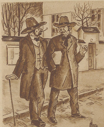
A. zu B.: — gut, erwarte mich in etwa zehn Minuten im Restaurant, ich muß nur noch schnell bei Müllerers nebenan eine Stunde geben!