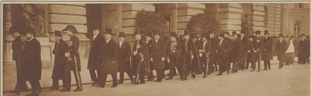
Das diplomatische Korps und die ausländischen Missionschefs in tiefem Schwarz und farbigen Uniformen im Trauerzuge