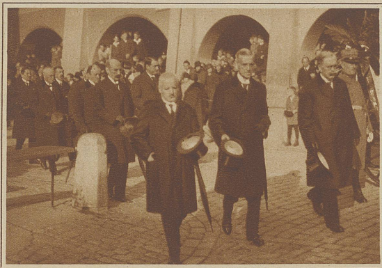
Eine der letzten Aufnahmen des verstorbenen