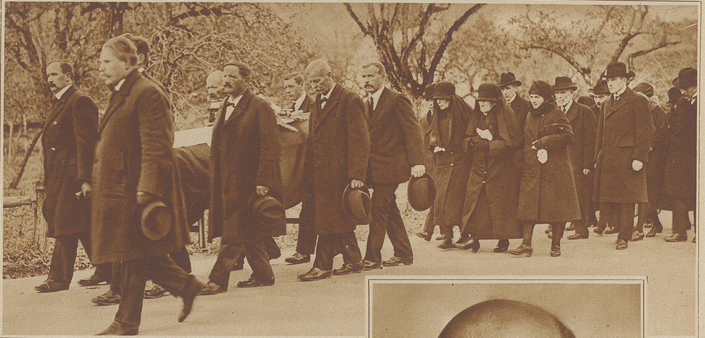
Die Bestattung in Gampelen. Dorfbewohner tragen den in die Schweizerfahne gehüllten Sarg zur Kirche. Hinter dem Sarg folgen von links nach rechts die Schwester, die hochbetagte Mutter und die Schwägerin des Verstorbenen