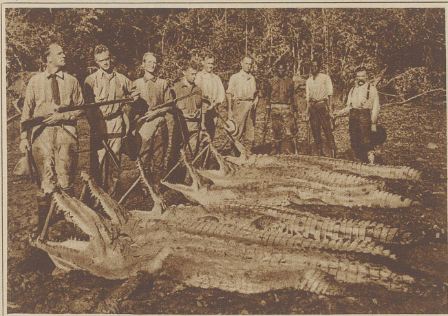
Sechs Krokodile, eine imponierende Jagdbeute aus einem den Urwald Brasiliens durchziehenden Strom

Das Pferd ist ein Haustier. Vorn hat es den Kopf, den kann es aufklappen. Oben sitzen die Ohren, die kann es hin- und herdrehen. Hinten ist der Schwanz. Wenn ich daran ziehe, muß ich schnell fortspringen. Es hat vier Beine, an