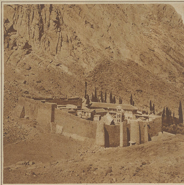
Sinai. Das festungsähnliche Katharinenkloster am Fuße des Mosesberges, rechts der Klostergarten

Karawanengefährten und Kamel zurücklassend, geh's mit einem alten Steinbockjäger zur Stätte der Gesetzesverkündigung, zum Serbal, dem «Geheimnis des Baal», jenen der Verehrung des Baal, Jehova, Christus und Allah geweihten altheiligen Horreb! Ein Geisterhauch aus jener sagenhaften Zeit umweht uns, wenn wir wagemutig den wildzerklüfteten Berg des Gottessehers Mosis erklimmen. Ueber vorspringende Felsgräte, haushohes Geröll, durch Einschnitte mit ausgehöhlten, längst verlassenen Einsiedlerzellen klettern wir die pfadlose Höhe empor. Die Haut hing mir schier in Fetzen vom Leibe, als ich den höchsten der fünf, durch tiefe Schluchten voneinander getrennten Gipfel, das überweite Beduinenhemd zwischen den Zähnen, die blutgetränkten Sandalen zerrissen an den Füßen, nach mühseligen sechs Stunden erklommen hatte. — Hier auf dem in den Aether getauchten düsteren Felsriesen, dem einstigen Throne des Baal, hier weitab von allem Irdischen, hat sich das weltbewegende Ereignis der Gesetzgebung abgespielt, während unten in der Tiefe, auf der weiten Ebene, sich das Volk in sehnsüchtiger Erwartung drängte.