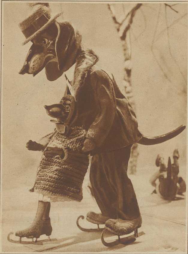
Familie Dackelbein beim Eislaufen