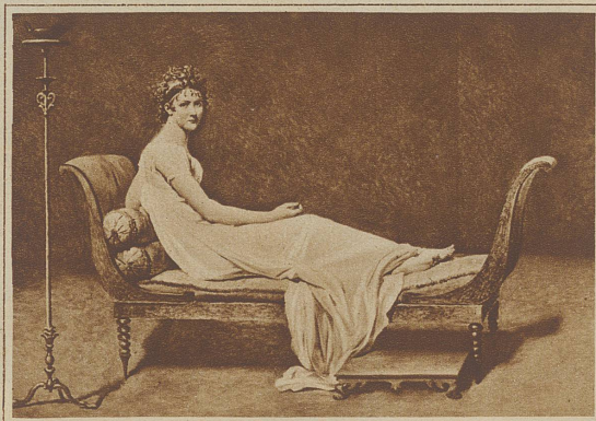
Porträt der Mme. Récamier von Jacques Louis David im Louvre in Paris

durch beide im Gesetz und Geheimnis der strömenden Kulturerscheinungen. — Das faustische Zeitalter hebt die Frau auf den Thron der Verehrung und überläßt ihr den mystischen Einfluß auf das Geistesleben. Wir sehen mit dem Eintritt der Germanen in die neuere Weltgeschichte, die Germanin königlich, gleichberechtigt und hochverehrt, dem Manne zur Seite stehen. In der Blütezeit des Rittertums 700 bis 1000 n. Chr.) wird ein Frauentypus zum Ideal, wie ihn die damalige Zeit gerade brauchen konnte und wie es in der Eigenart jener Epoche begründet lag: Die große, blonde, vollschlanke, edle Frau, die Burgherrin. Hoheitsvoll und gelassen steht sie vor dem