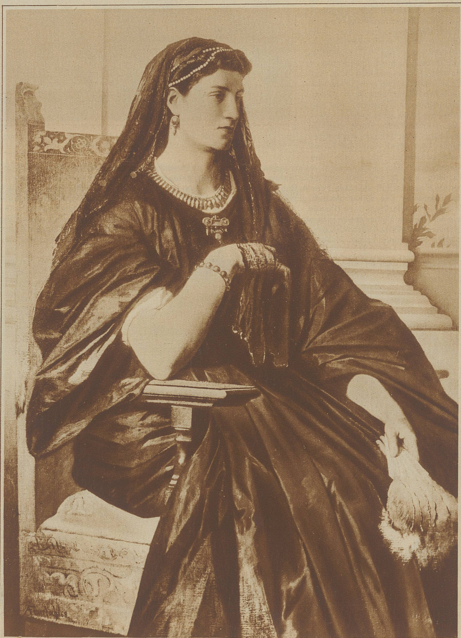
Untenstehendes Bild: Die «Römerin» Anselm Feuerbachs, der ideale Frauentyp der zweiten Hälfte des vorigen Jahrhunderts

Im Empire blieb die Frau leicht spielerisch, doch sie war klug, etwas kühl, etwas steif. Sie glich den mit sparsamen Ornamenten versehenen, vornehmen Möbeln ihrer Zeit. Sie wußte Abstand zu wahren, saß mit Selbstverständlichkeit auf dem Thron der Verehrung und ließ sich mit dem Glorienschein umweben, den Mannessinn ihr bot. Auf das geistige Leben ihrer Zeit übte sie einen großen Einfluß aus, aber nicht auf den Mann selbst — vielleicht weil sie zu einsam, zu selbstgefällig auf ihrer Höhe stand.