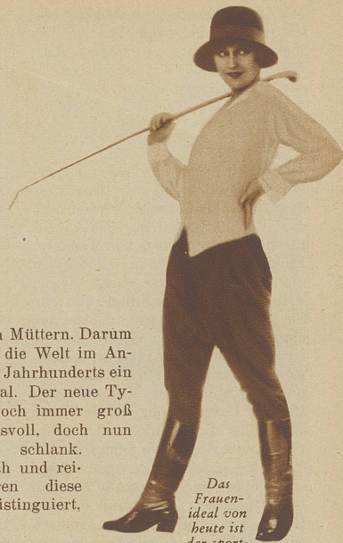
Das Frauenideal von heute ist der sportlich trainierte, vermannlichte Typ