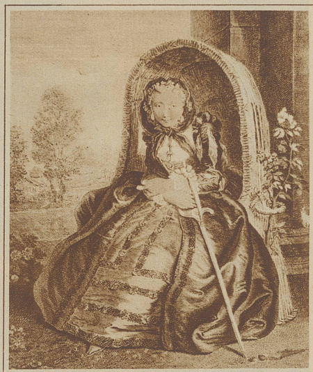
Aus der Zeit des Rokoko

Zu allen Zeiten war die edle Frau der gute Genius des Mannes.