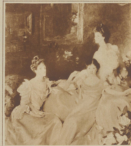
Die drei Frauen Gemälde von Sargent. Ein charakteristisches Bild für die hochbürgerliche Eleganz vom Anfang des Jahrhunderts