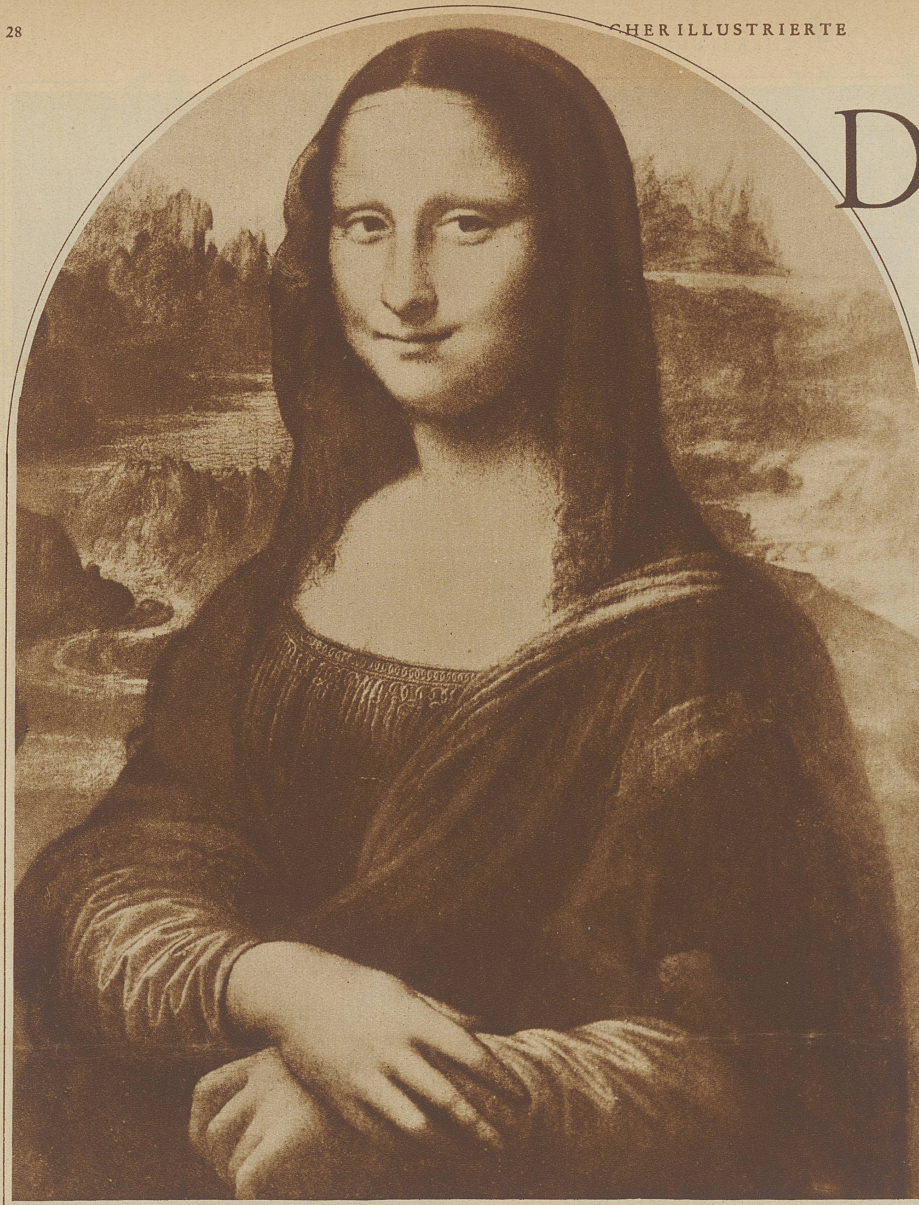
Mona Lisa. Gemälde von Leonardo da Vinci. Ein Beispiel für den Schönheitsstyp der klassischen Renaissance