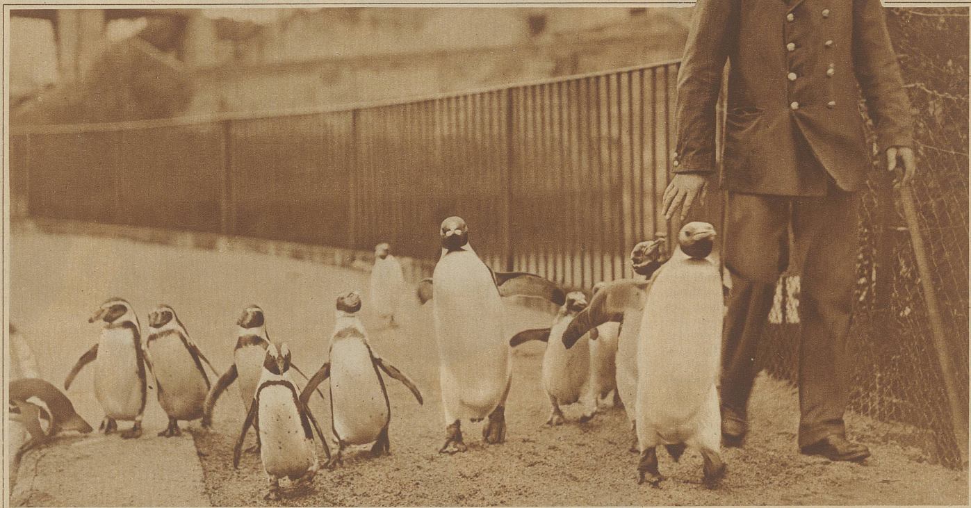
Die Pinguine des Zoologischen Gartens begeben sich mit dem Wärter zum Herrn Direktor, um ihm ein gutes neues Jahr zu wünschen