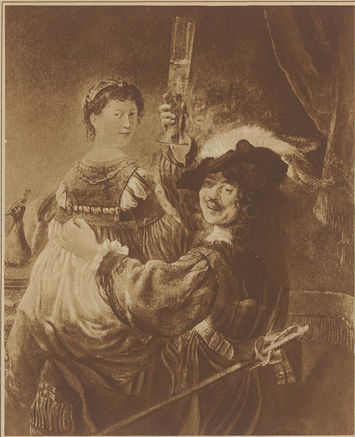
Rembrandts Selbstbildnis mit seiner Frau, ein Beispiel für den bürgerlich behaglichen Typ seiner Zeit

Wenn wir zurückblicken auf die einzelnen Perioden, so finden wir im Rittertum, zu Anfang des 20. Jahrhunderts und in der gegenwärtigen Epoche den größten Gegensatz zwischen männlichem und weiblichem Prinzip. Es sind die Zeiten, wo die Frau am höchsten verehrt wird. Denn je männlicher und stärker der Mann, desto ritterlicher und zartempfindender ist er gegen die Frauen. Je zarter und weicher die Frau, desto höher steht ihre Macht. Nie ist die Frau stärker und erfolgreicher, als wenn sie gütig, fein und echt weiblich ist!