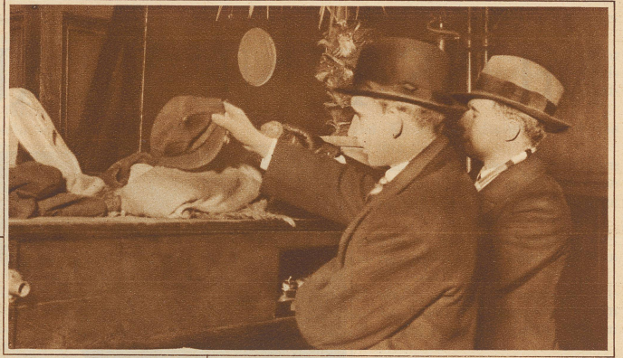
In dem angstvollen Gedränge verloren viele Kinder zum Teil ihre Kleider, oder aber sie wurden ihnen vom Leibe gerissen. Unter den gesammelten Stücken suchen nun die Väter die ihnen bekannten Sachen heraus

Siebenhundert Kinder besuchten in Paisley am Neujahrsvormittag eine für sie angesetzte Kinovorführung. Ein Film geriet in Brand. Unter den Kindern entstand eine Panik, bei der 72 Kinder im Gedränge ums Leben gekommen sind