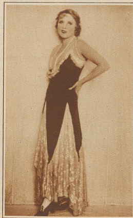
Bild rechts: Ein neuer jugendlicher Frauentyp; selbstbewußt und aufgeklärt und dennoch irgendwie an den romantischen Backfisch erinnernd