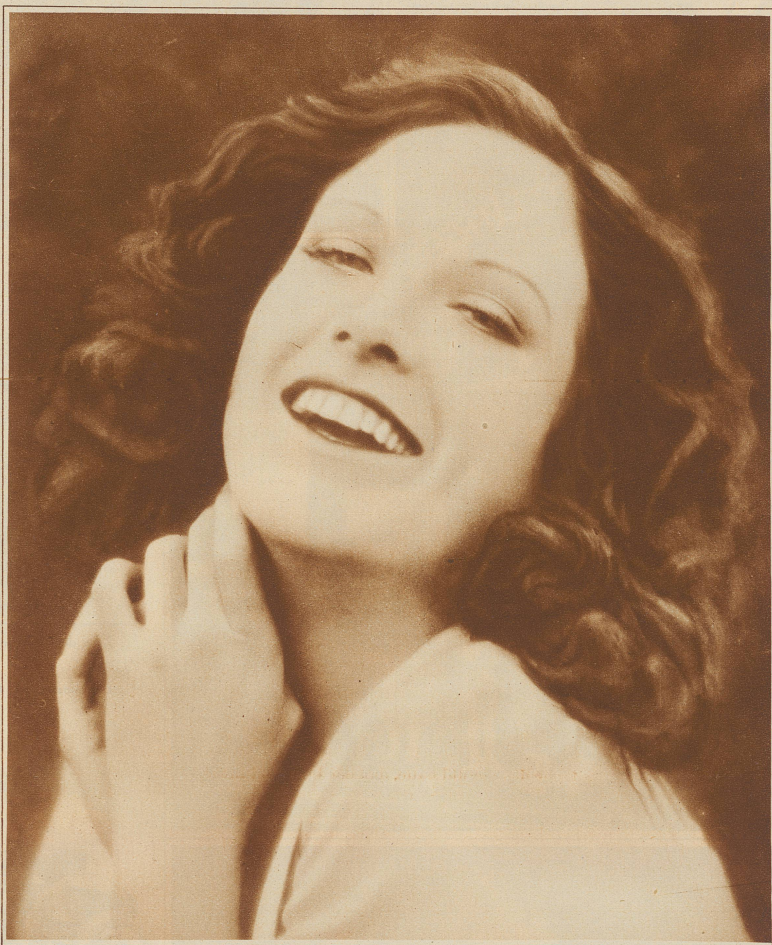
Das Lachen, welches seinen Ursprung in einem gütigen und neidlosen Herzen hat, ist eines der allermächtigsten Anziehungsmittel, das seine Kraft in allen Altersstufen bewahrt

Die von der heutigen Gesellschaftsordnung gebotenen Möglichkeiten zu individueller Entfaltung weiblicher Vielseitigkeit sollen dazu beigetragen haben, daß unvoreilhaftige Gesichtszüge sich milderten, anstatt wie einst sich in Verbitterung zu verschärfen. Kein junges Mädchen braucht heutzutage «schön» zu sein, wenn es einen frischen, gesunden, halbwegs sportgestählten Eindruck macht.