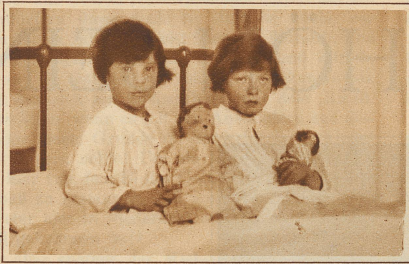
Bild links: Zwei siebenjährige, gerettete Mädchen im Krankenhaus zu Glasgow