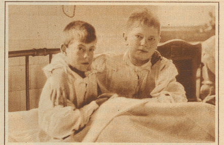
Zwei der Katastrophe entronnene Buben im Krankenhaus zu Glasgow