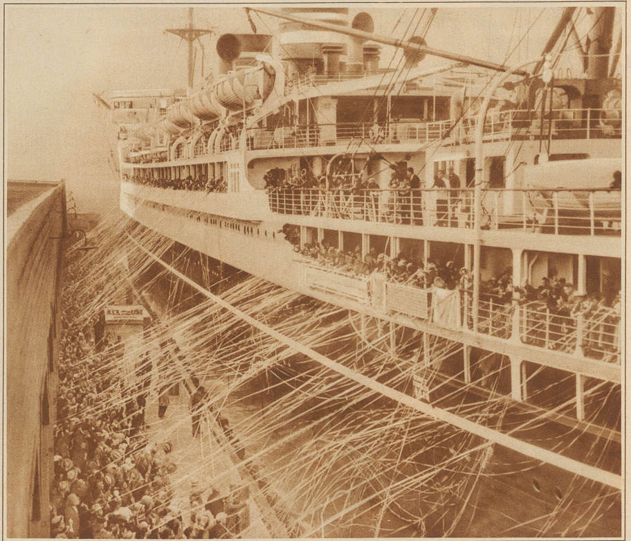
Abfahrt eines großen Meerschiffes

Herzlich grüßt Euch alle Der Unggle Redakter.