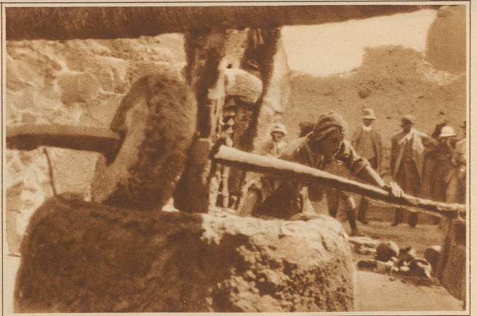
So werden die Oliven gemahlen. Im Hintergrund (Mitte) sieht man einen Teil der zur Presse gehörenden Holzschraube