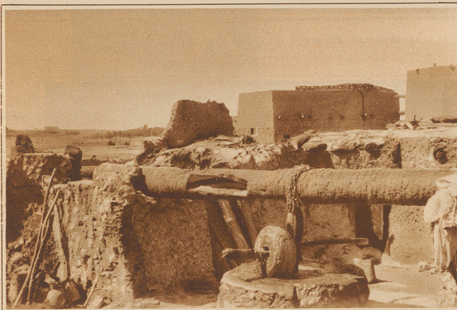
Oelmühle unter freiem Himmel