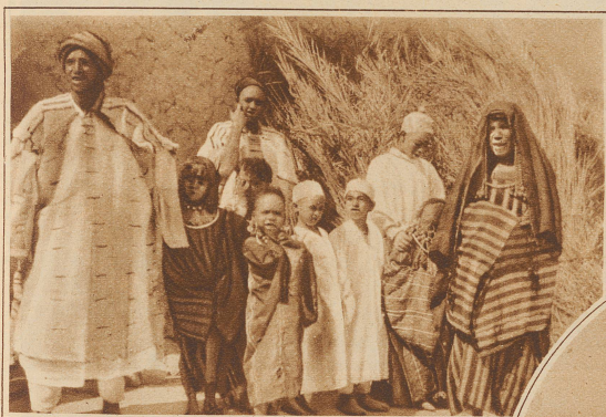
Ein «besserer Herr» mit seinen Frauen und Kindern

Die Häuser sind aus luftgetrockneten Schlammziegeln, denen als Bindemittel Kamelmist beigegeben ist, aufgebaut. Einem tüchtigen Regen halten die Mauern nicht stand. Das letztmal regnete es in Siwah vor 15 Jahren. Damals wurde eine Großzahl der auf dem Felsenhügel errichteten Häuser zerstört, die dann nicht mehr am höchsten Punkt, sondern in der Niederung wieder aufgestellt wurden. Zwischen den Palmenhainen im Hintergrund sind ausgedehnte Salzseen sichtbar, an deren Ufern nur dürftiges Gestrüpp wächst