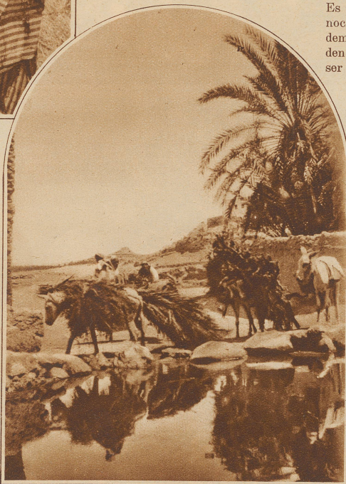
Eine der mehreren hundert Süßwasserquellen aus der Umgebung der Oase