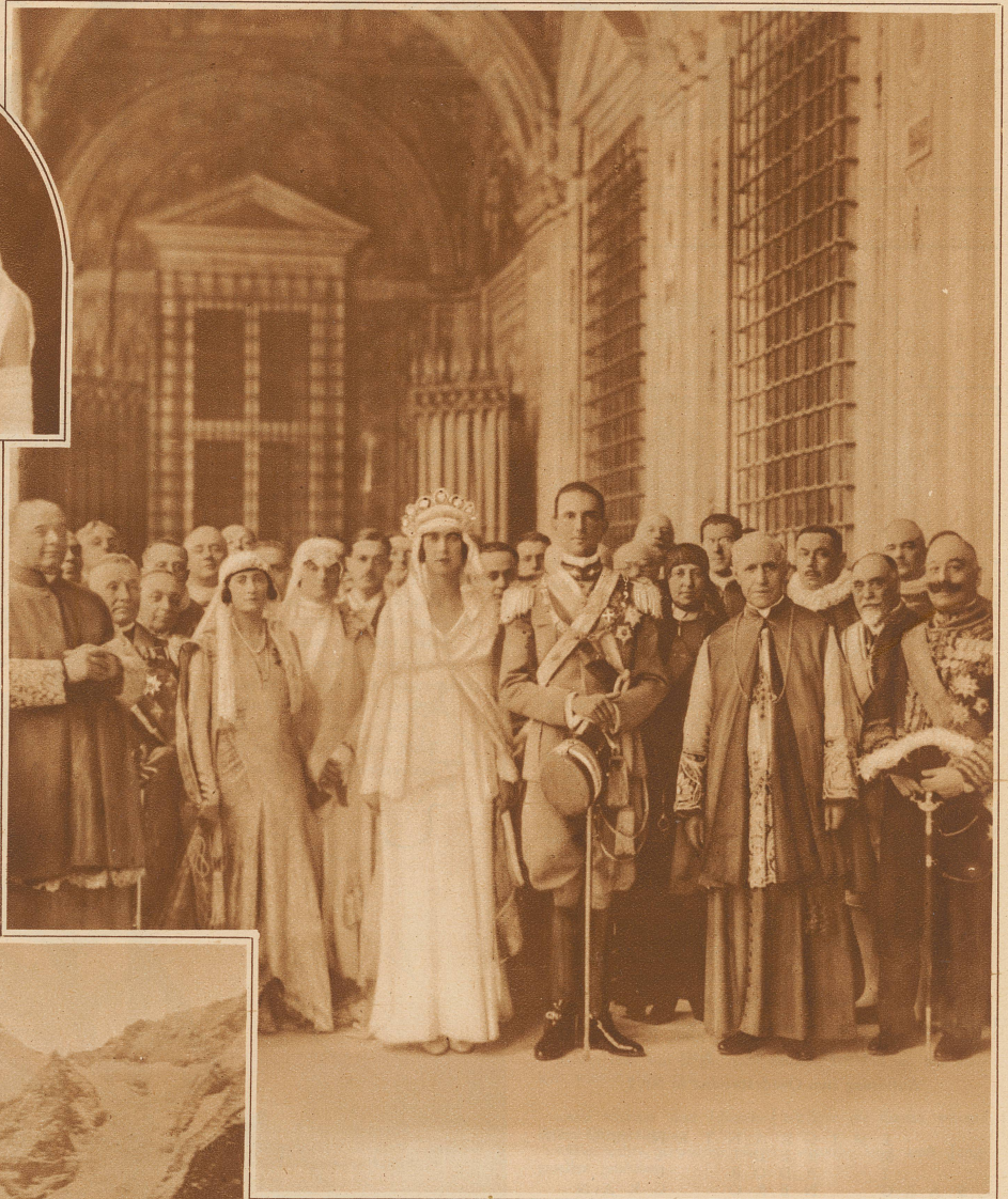
Das neuvermählte Paar im Vatikan, bereit, den Segen des Papstes zu empfangen