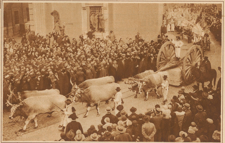
Am Tage der Vermählung fand in Rom ein interessanter Trachtenumzug statt, der das bodenständige Italien von den Alpen bis Sizilien zeigte. Viel Beachtung fand dabei der im Bilde festgehaltene Ochsenzug mit einem viele Zentner schweren Marmorblock