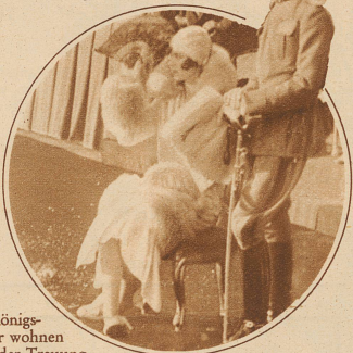
Die Königskinder wohnen nach der Trauung einer zu ihren Ehren veranstalteten großen Parade bei