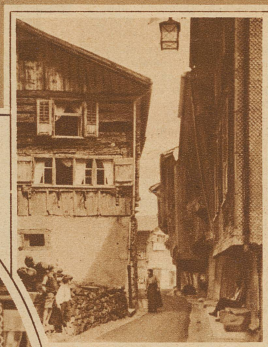
Ein malerischer Winkel