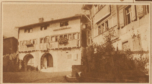
Der alte Marktplatz

Die Grafen von Werdenberg waren einmal ein mächtiges Geschlecht am Rhein, aber sie verarmten und der letzte Werdenberger, Graf Rudolf, schlüpfte 1404 in den einfachen Kittel eines Appenzeller Bauern. Ein wenig «Herr von Werdenberg» dünkt sich aber heute noch jeder echte Bewohner dieses Städtchens mit seinen sonnenverbrannten hölzernen Stirnwänden, den sacht geneigten Fassaden, bemalt mit frommen Haussegen und sinnigen Sprüchen. Das ganze Städtlein besteht sozusagen aus zwei Gassen und da sind die Häuser derart ineinandergebaut und verschachtelt, daß es bei Einführung des schweiz. Grundbuchs nirgends mehr Arbeit für die Grundbuchbeamten gegeben hat, als bei den Servitutfragen in Werdenberg. Auf den schmalen Vorgesimsen der heimeligen Häuser flammt im Sommer das Feuer der Geranien und über der ganzen Siedlung erhebt sich als grauer Schutzherr der Turm des Schlosses. Am Schlosse selber, sagte man, haben die Werdenberger Grafen so lange gebaut, bis ihnen das Geld ausging, so wie das heute noch hie und da beim Bauen vorkommt. Nach des letzten Werdenbergers Flucht setzte sich ein Glarner Land-