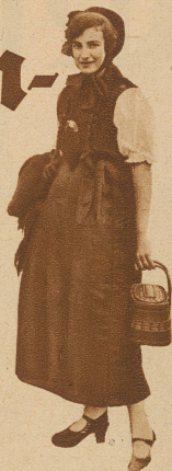
Werdenberger Tracht