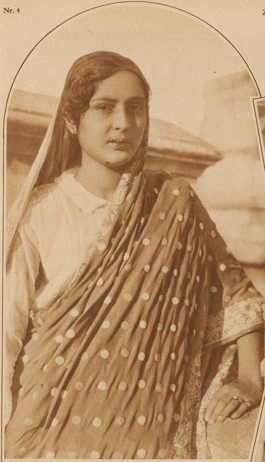
Eine Tänzerin aus Agra. «Die schöne Gumua»