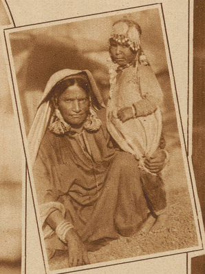
Hindumädchen aus Nord-Kashmir mit reichem Silberschmuck