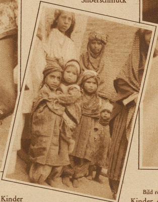
Kinder aus einem Dorf in Zentralpersien (bei Jeszd)