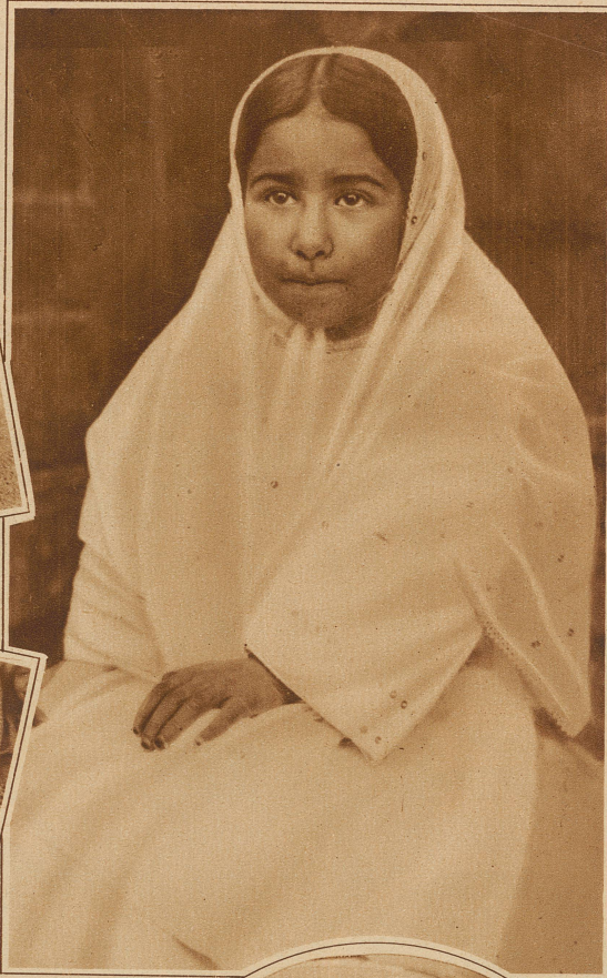
Nebenstehendes Bild rechts: Eine kleine persische Schönheit aus Ispahan