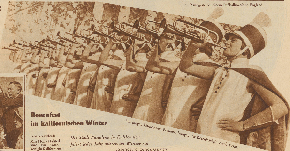
Zaungäste bei einem Fußballmatch in England

Es ist fast nicht zu glauben, daß noch im Jahre 1930 Menschen in solch licht- und sonnenlosen Winkeln hausen müssen. Die Gesundheitspolizei hat nun allerdings beschlossen, dieses nur 2,50 Meter breite Gäßchen — es hat übrigens den verheißungsvollen Namen «Rue de Venise» — mit möglicher Beschleunigung zu räumen und niederzureißen