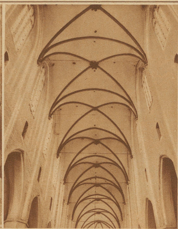
Gewölbe der Katharinenkirche, Lübeck

Technik — mit einem Kleinmaß an Anstrengung und Material ein Höchstmaß an Leistung zu erzielen — nicht schon in der Natur deutlich ausgeprägt? Findet man nicht in der Natur das Gesetz der Serie verwirklicht, d. h. die Wiederholung von Stücken