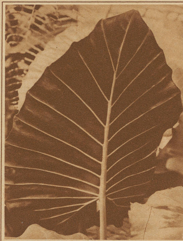
Rückseite eines Blattes von Callocaria antiquorum