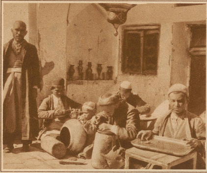
Bild links: Berühmt sind die Kupfer- und Messingschmiede in Ispahan. Man beachte den kleinen Künstler in der Mitte des Bildes

Gefäß, an dem er arbeitete, reichte ihm bis an das Kinn.