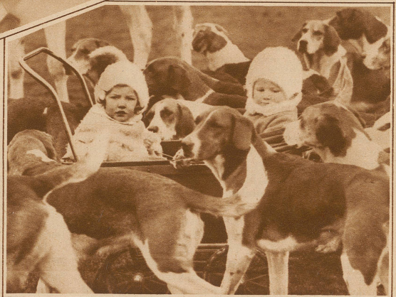
Gute Freunde. In England werden die Kinder schon früh an den Betrieb der großen Jagden gewöhnt. Mitten in der Hundemeute steht der Kinderwagen der kleinen Prinzessinnen, die dereinst als große Damen hoch zu Roß sich selber an den Jagden beteiligen werden.