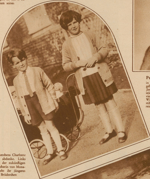
Töchterchen Charlotte (Bild) abdanke. Links neben der zukünftigen Herrscherin von Monaco steht ihr jüngeres Brüderchen

Es kriselt in Monaco. Die Monacesen sind seit längerer Zeit mit ihrem Fürsten unzufrieden. Schon letztes Jahr wurden kleine Revolutionchen inszeniert, jedoch ohne größere Bedeutung. Gegenwärtig ist die Bewegung wieder stärker. Man verlangt vom Fürsten nicht weniger, als daß er zu Gunsten seines