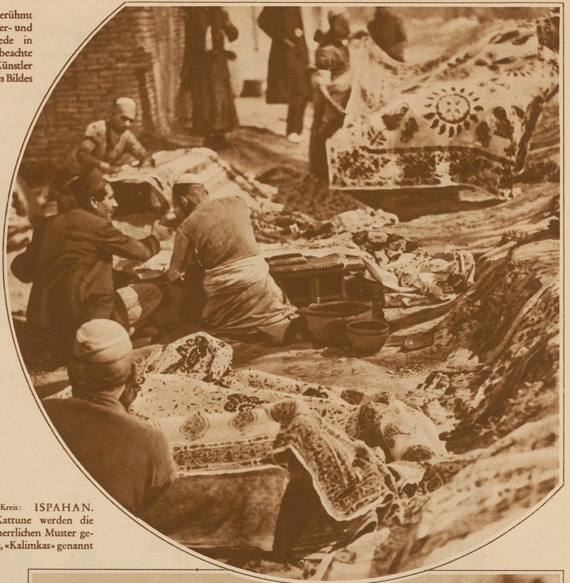
Bild im Kreis: ISPAHAN. Auf Kattune werden die alten herrlichen Muster gedruckt, «Kalimkas» genannt