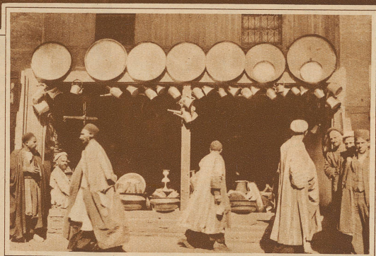
Kaufen Sie Tablette, Kannen, Krüge . . . ! Messingbasar in Ispahan

Ispahan besitzt die größten Basare von Persien.