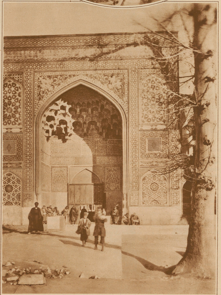
Eingang zur Hohen Schule von Chahar-bagh in Ispahan