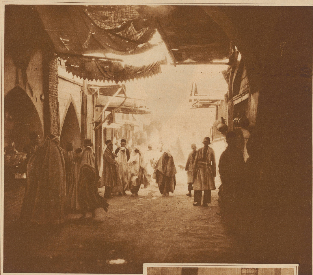
Eine Basarstraße in Kirman (Zentralpersien), der Stadt, die durch ihre Teppiche berühmt ist. Die Frauen – in Weiß gekleidet – sehen wie Gespenster aus. Man sieht auch eine schwarzgekleidete Dame – das ist die Mode aus Teheran!

VON BERNHARD KELLERMANN