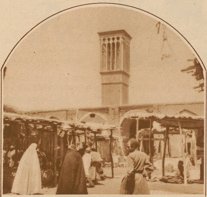
KIRMAN. Der Turm ist nichts als eine Art Schornstein, der den zwei Stockwerke unter der Erde liegenden kühlen Gemächern Luft zuführt. Temperatur 40—50 Grad Celsius am Schatten

Die Basare von Jезд und Kirman sind ziemlich dunkel, die Oeffnungen, die das Licht einlassen, sind spärlich und winzig. Auf diese Weise panzern sich die Basare gegen die mörderische Hitze, die wie glühendes Blei auf den Dächern liegt.