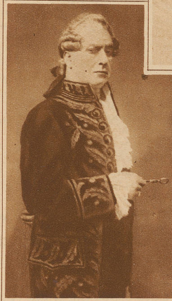
MARIANO STABILE, der trotz seines noch jugendlichen Alters als «Nach- folger von Battistini» bezeichnet wird, absolviert nächste Woche ein Konzert im Zürcher Stadttheater. Der berühmte Bantone der Mailänder Scala ist auch für die diesjährige Stagione verpflichtet

Gott Lob und Dank! Schon schlug das Grütli die dunkelbraunen Augen zu dem Peter auf.