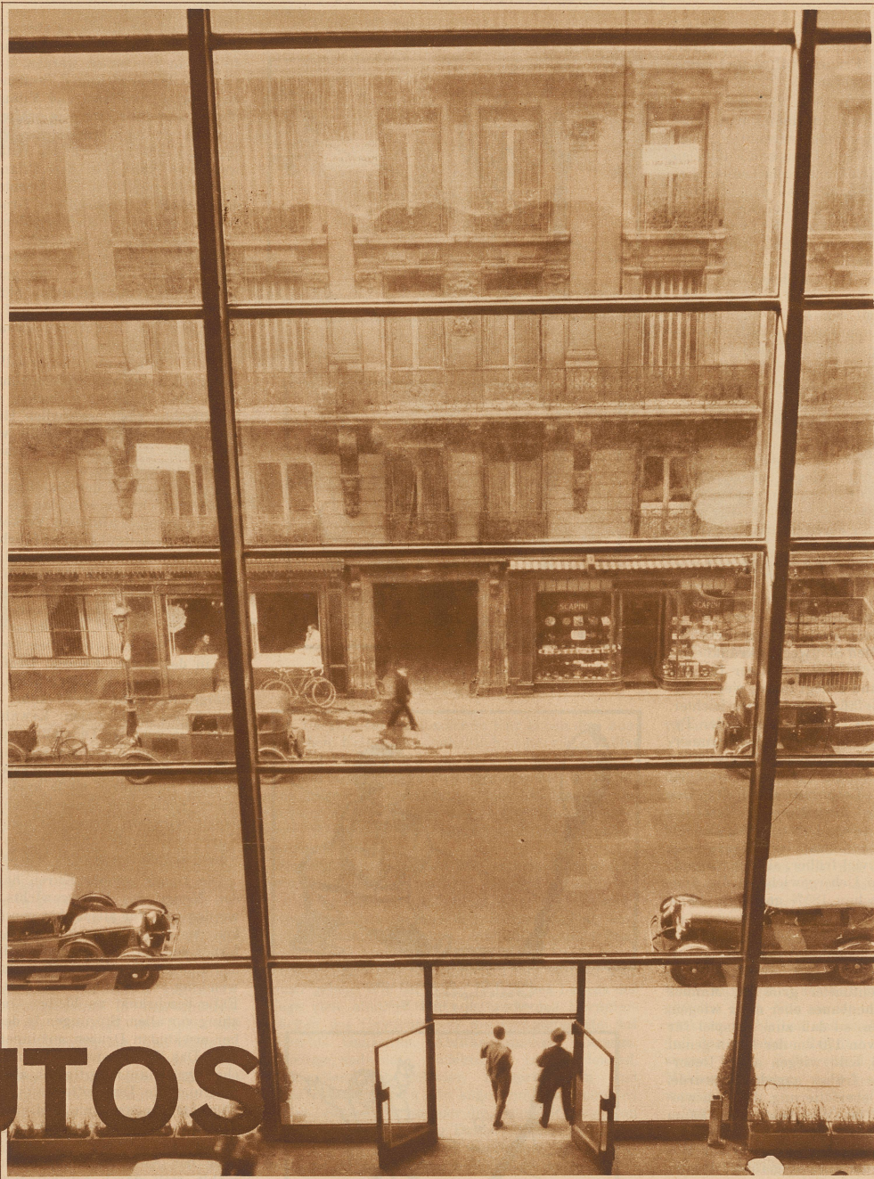
Blick durch die 5 stöckige Glaswand eines Pariser «Warenhauses» für Autos. Die Wand erscheint ganz schwebend, trotzdem das Eisengerippe der ungeheuren Glasflächen 19 000 kg wiegt

In allen Großstädten wird augenblicklich der Kampf zwischen Auto und Straße ausgefochten. Das Auto hat sich entwickelt. Die Stadt ist starr geblieben. Wird das Auto von der Wohn- oder Geschäftsstraße verschwinden, oder wird der Stadtplan sich ändern? Werden an Stelle von hygienisch unhaltbaren Vierteln im Stadttünnern planmäßig und in weiten Abständen Wolkenkratzer entstehen, oder wird man mit Hilfe von komplizierten Tunnels und Aufbauten die Kreuzungsstellen des Verkehrs auflösen?