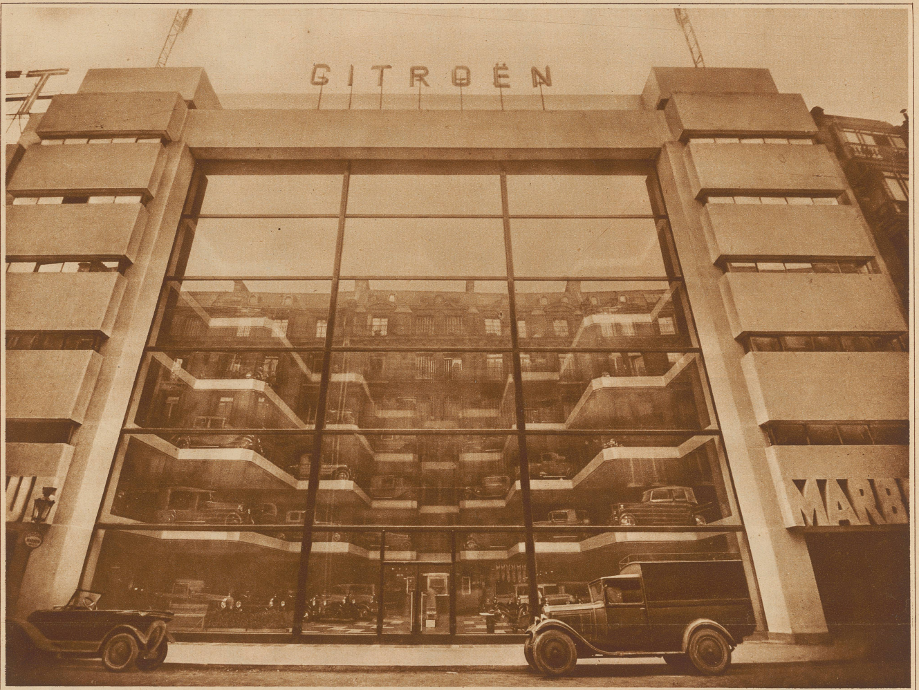
Das «Warenhaus» für Automobile von der Straße aus gesehen.

Mit einem einzigen Augenaufschlag kann man auch von außen das ganze Lager überblicken. Im oberen Teil der Glaswand spiegelt sich der gegenüberliegende Häuserblock wider.