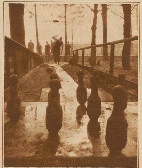
Oba lätz! Näbeduse

Defagter Mann macht wenig Freude Und er ist meistens unbeliebt, Weil er in kritischen Momenten Die allerdümmsten Sachen schiebt. Er schmeißt im Wies um, was grad fällt, Und hat «sein Sach» auf nichts gestellt!