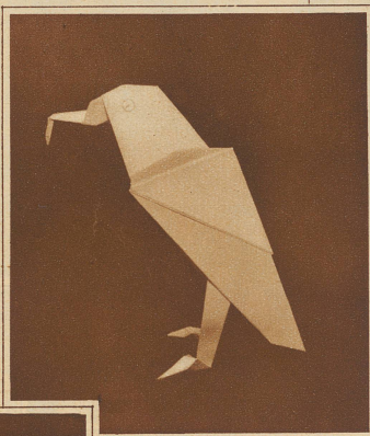
Habicht von Unamuno aus Papier gefaltet, ohne zu schneiden oder zu kleben

— und dann entstand das Tier! Wie Sie sehen streng kubistisch! Zwischen der Kaffeetasse und einem Strauß früher Rosen stand der Habicht fest auf seinen papiernen Beinchen!