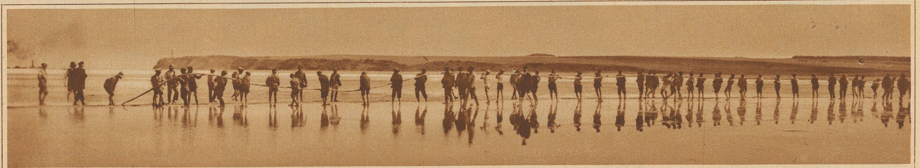
Ausschleppen des längsten See-Fernsprechkabels der Welt, das zwischen Finnland und Schweden gelegt wurde