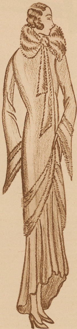
Abendmantel 3/4 lang in nilgrüner Seidenpame