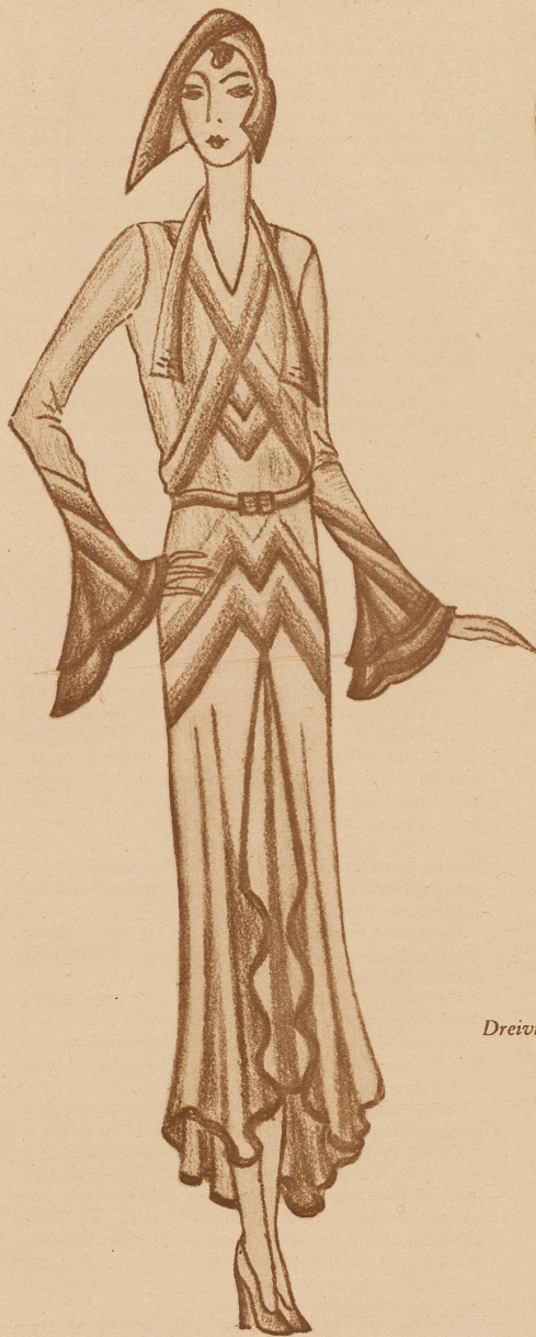
Nachmittagskleid in blauem Satin