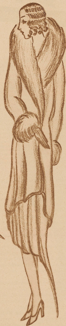
Dreiviertel-Mantel in braunem Satin