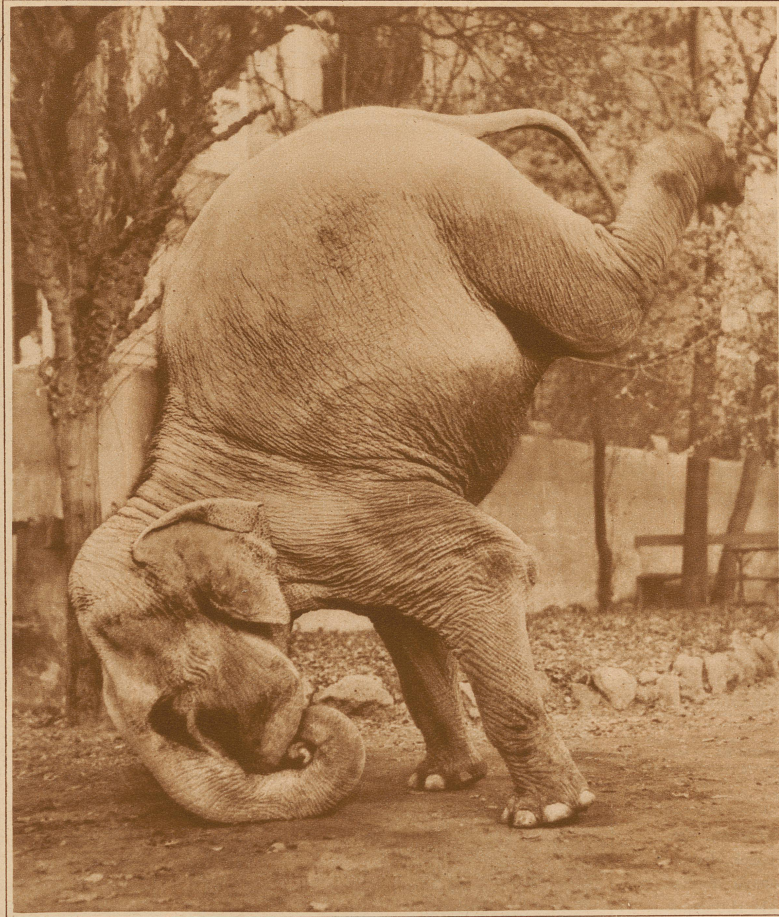
Elefantenfastnacht. Seitdem der Elefant hier einige Zeit in Europa zugebracht hat, fängt er an, Verständnis für die Fastnacht zu bekommen und macht auf seine Weise auch mit

Eine schwere Verantwortung laden sich solche Pflücker allerdings auf. Mit der in diesem Falle harmlosen