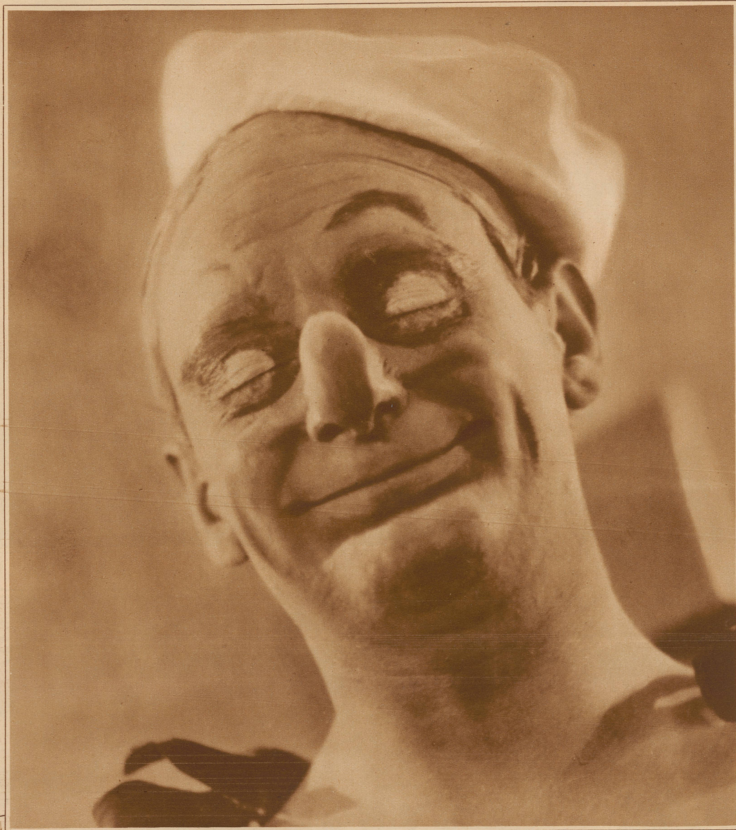
Einer der Brüder Price. Niemand wird ihn um seine Häßlichkeit beneiden, wohl aber um die selige Stimmung des Gemütes, wie sie ihm vom Gesicht zu lesen ist