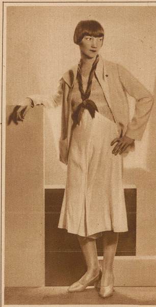
Neuartiges Kostüm mit Hosenrock in weißem Wollstoff Allerdings mehr originell als schön

Kurz oder halblang? ... das ist hier die Frage. Wenn Röcke länger, Hüte groß werden, warum soll dann der Handschuh kurz bleiben! — Als die Dame am Volant die hohe Manschette des pelzgefütterten Autohandschuhs über den Mantelärmel zog, fand sie das nicht nur praktisch, es schmeichelte auch ihrem Sinn für Eleganz. Und da der Handschuhfabrikant ein aufmerksamer Herr ist, legt er ihr nun zum neuen Frühjahrskostüm und Kleid sein neues halblanges Sortiment, wenn auch nicht zu Füßen, so vertrauensvoll in die Hand. — Typen in einfacher Form, aber mit Knopfschluß an der Seite, dunkle Handschuhe mit goldenen Knöpfen am Lederarmband, glatte Typen oben abgerundet und wie Etagevolants farbig eingefasst, gerade breite Stulpen aus verschiedenfarbigen Lederstreifen zusammengesetzt usw. usw. — Damit der kurze Einknopfhandschuh sich nicht vernachlässigt fühle, hat man ihn auch mit neuen Dekors bedacht, die weniger bunt und von ruhiger Linie sind. Auch amüsanter Ausgestaltung seiner «Raupen» schenkt man Beachtung. — Favorit der geschmackssicheren Dame sind der kurze bis halblange weiße und der lange schwarze Handschuh. Ersteren trägt sie im Theater. Der zweite kann mit und ohne Echo — in Ansteckblume und Schuh — einer bereits getragenen hellen, Abendrobe neuen pikanten Akzent verleihen. tp.