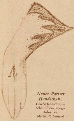
Neuer Pariser Handschuh: Glas-Handschuh in Schlupfform, vorge- führt bei Martial & Armand