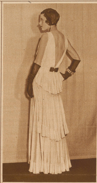
Eine raffinierte Weiß-Schwarz-Komposition (Modell Worth)