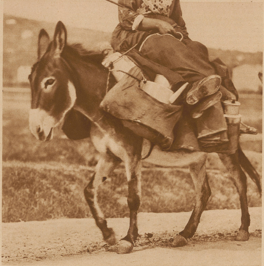
Istrische Bauernfrau mit der Morgenmilch auf dem Wege nach Triest

E s gibt eine Legende, über die hier der geneigte Leser nachdenken möge. Als der große Meister die Tiere um sich versammelte, um jedem den Namen zu geben, kam auch der kleine, graue Esel an die Reihe. Der Vierbeiner trat vor und der große Meister sagte etwas kurz und bündig: «Du bist ein Esel.» Bis dahin, freundlicher Leser, wird diese Legende stets gleich erzählt, aber jetzt folgen zwei Varianten, die höchst bedeutsam sind. Die eine erzählt, daß der Esel nach dieser Namenskrönung ein freundliches Danke gesagt habe, die andere Variante aber berichtet, daß das Grautier sich über den Namen höchlichst entsetzt und beleidigt gezeigt habe. Hier ist das Problem. Wir erklären uns für die erste Variante. Denn für uns steht für allemal fest, daß der Esel seinen Namen im Anfang durchaus mit Stolz tragen durfte und daß diese Ehrenbezeichnung erst durch menschliches Dazutun entwürdigt worden ist. Der Mensch hat die häßliche, aber eingefleischte Unart, stets in Bildern und Vergleichen zu reden. Statt daß er sagt: «Diese Wiese ist gemäht worden», gestreichelt er: «Diese Wiese wurde rasiert». Oder statt daß er sachlich feststellt: «Seine Füße sind groß», holt er das schlechte Bild: «Seine Füße sind wie Dampfschiffe». Um etwas zu erklären, muß er immer Vergleiche machen, als ob die ganze Welt