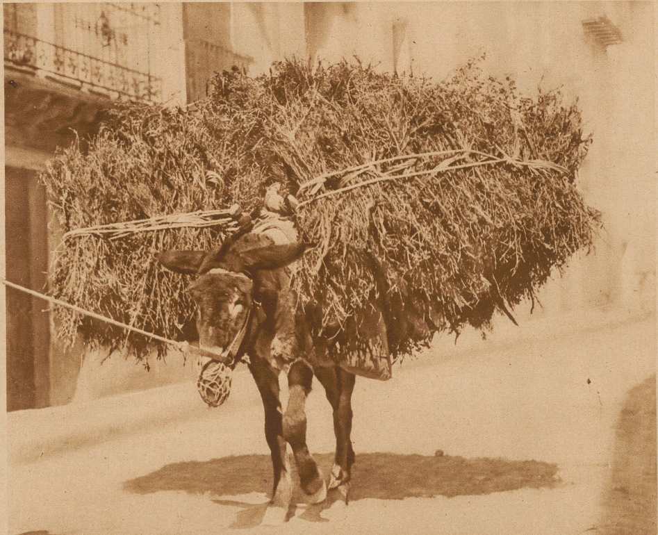
Der Kuli der Tierwelt, mit einer schweren Last Reisig bepackt