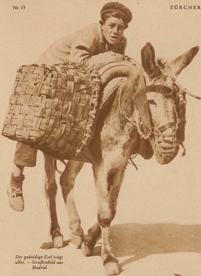
Der geduldige Esel trägt alles. - Straßenschild aus Madrid

muß, auch wenn man ihm das mit hundert Rutenstreichungen austreiben will. Er sackt tausend Rutenstreichungen ein und tut auch gar nichts anderes, als sich immer fester in den Boden zu scharren; man reißt hinten und zieht vorn, haut und behandelt sein Fell mit Fußtritt: er bleibt stehen; man ruft ihm süße Worte