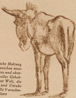
Diese nachdenkliche Haltung ist unbedingt Anzeichen eines reichen Innenlebens und oben drein ein widerwärtiges Gebahren gegenüber einer Welt, die vor lauter Hast und Unruhe nach und nach alle Vornehmheit verliert