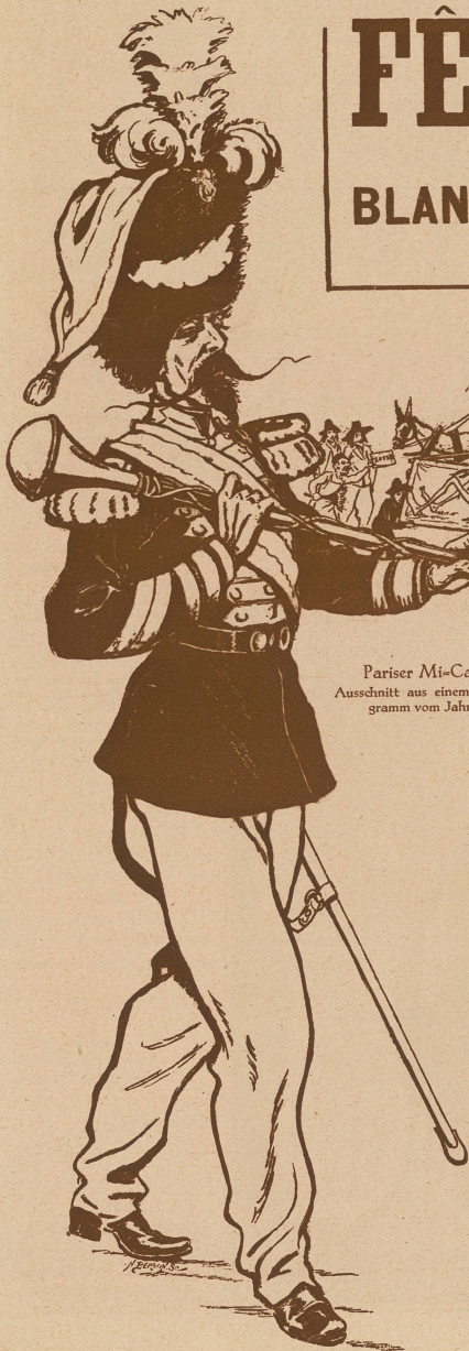
Pariser Mi-Carême. Ausschnitt aus einem alten Programm vom Jahre 1895

BLANCHISSEUSES, ÉTUDIANTS, VACHE ENRAGÉE CHARS DES HALLES ET DU TEMPLE