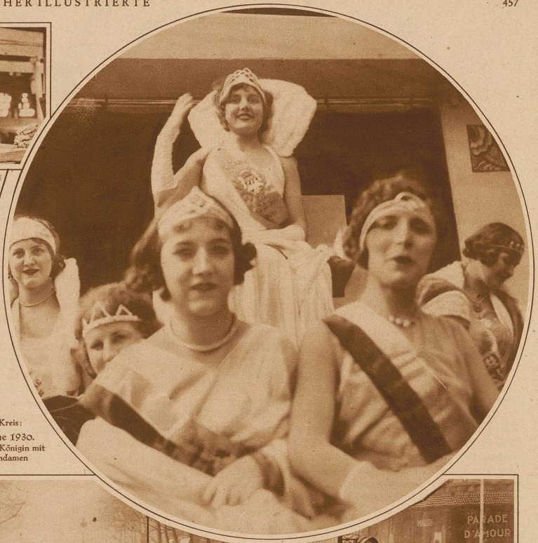
Rechts im Kreis: Mi-Carême 1930. Die diesjährige Königin mit ihren Ehrendamen