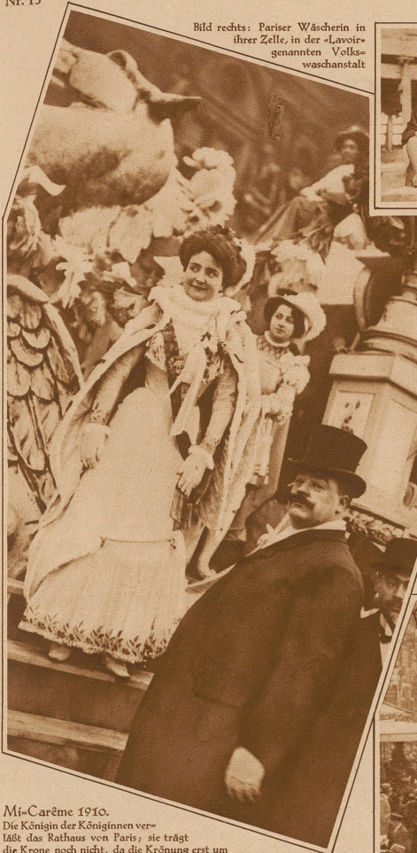
Mi-Carême 1910. Die Königin der Königinnen verläßt das Rathaus von Paris; sie trägt die Krone noch nicht, da die Krönung erst um Mitternacht erfolgt. — Zum Thema: «Schönheitsideal und Mode vor 20 Jahren» kann sich jeder Leser sein eigenes Sprüchlein machen