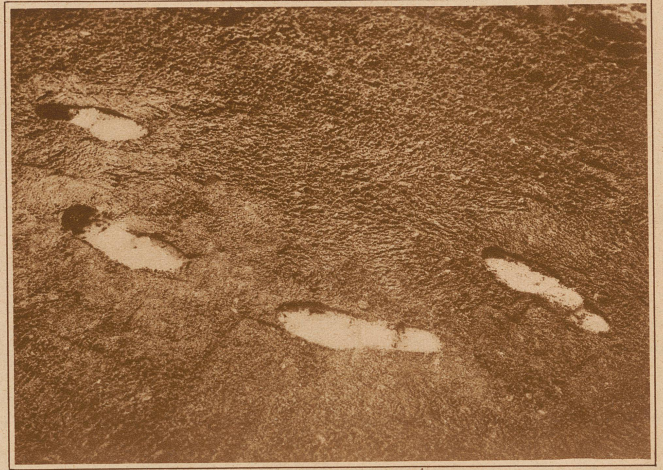
Fußspur. Der Mann kam von rechts und machte einen Sprung nach vorn, wobei er nun der Gehrichtung den Rücken kehrt. (Man beachte den tiefen Eindruck der Absätze an den beiden linken Spuren.) Nun ging der Täter eine Strecke nach rückwärts, um seine Verfolger zu täuschen.

Lage kommen sollte, als erster auf einem Tatort anwesend zu sein, wird deshalb darauf achten müssen, keine Spuren zu verwischen. Die scheinbar unbedeutendsten Dinge können manchmal von größter Wichtigkeit sein. E. H.