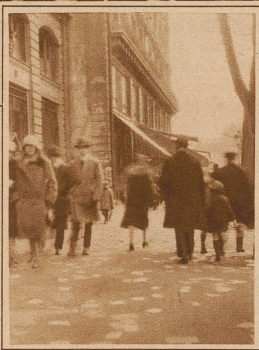
Am Abend liegen Millionen und Abermillionen von Papierfetzen, meist Reklametzettel, auf den Straßen herum

Mit jedem Jahre steigt das Interesse, das die Reklame am Umzug des Mi-Carême nimmt. Da es ein Fest der kleinbürgerlichen Massen ist, so richtet