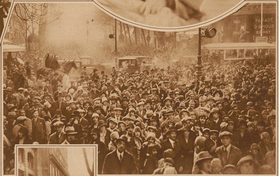
Die gewaltige Menschenmenge auf den großen Boulevards in Erwartung des Mi-Carême-Festzuges