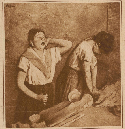
In der Wäscherei Gemälde von Desgas

Begonnen hat es mit der Königin der Wäsche-