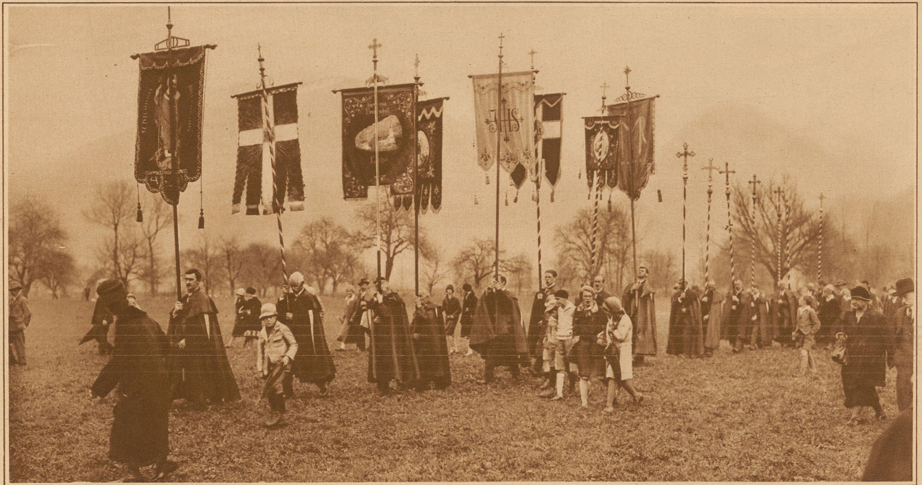
Näfelfahrt. Alljährlich am ersten Donnerstag im April begehen die Glarner ihre Gedenkfahrt an den im Jahre 1389 über die Oesterreicher erfochtenen Sieg. Der feierliche Aufzug der «Fahrt» beginnt in Schneisingen und bewegt sich dann von Gedenkstein zu Gedenkstein (es sind deren elf) bis gegen Mühlhäusern. Jedes Haus des Glarnerlandes sendet den besten und ehrbarsten Mann nach Näfels in die «Fahrt», die mit einem feierlichen Hochamt ihren Abschluß findet.