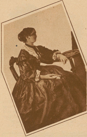
Die Sängerin EMILIE HEIM , aus den Escherhäusern, eine junge schöne Schweizerin mit einer herrlichen Sopranstimme, die von Wagner stets als Solistin zugezogen wurde, obwohl sie als Dilettantin keine vollendere Ausbildung besaß