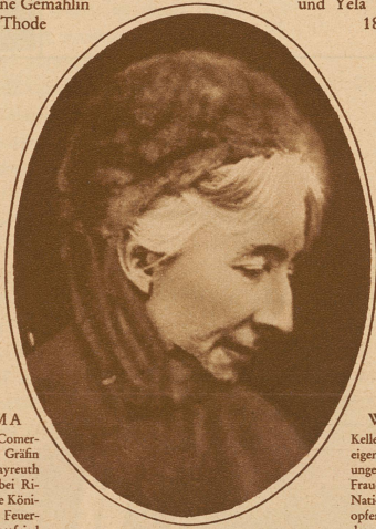
COSIMA am 25. Dezember 1837 in Bellagio am Comersee als Tochter Franz Liszts und der Gräfin d'Agoult geboren, ist am 1. April in Bayreuth gestorben. 1857 war sie 3 Wochen lang bei Richard Wagner in Zürich zu Gast, als eine Königin der Salons. Gottfried Keller, Semper, Feuerbach u. a. sind ihr in Zürich begegnet. Gottfried