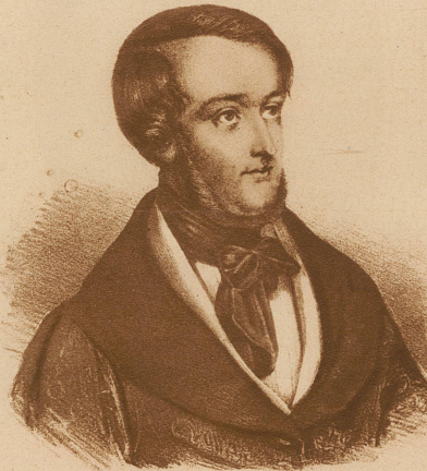
Richard Wagner, ehemal. Capellmeister und politischer Flüchtling aus Dresden

Extra-Beilage zu Eberhardt's Allgem. Polizei-Anzeiger. Band XXXVI. N° 47.