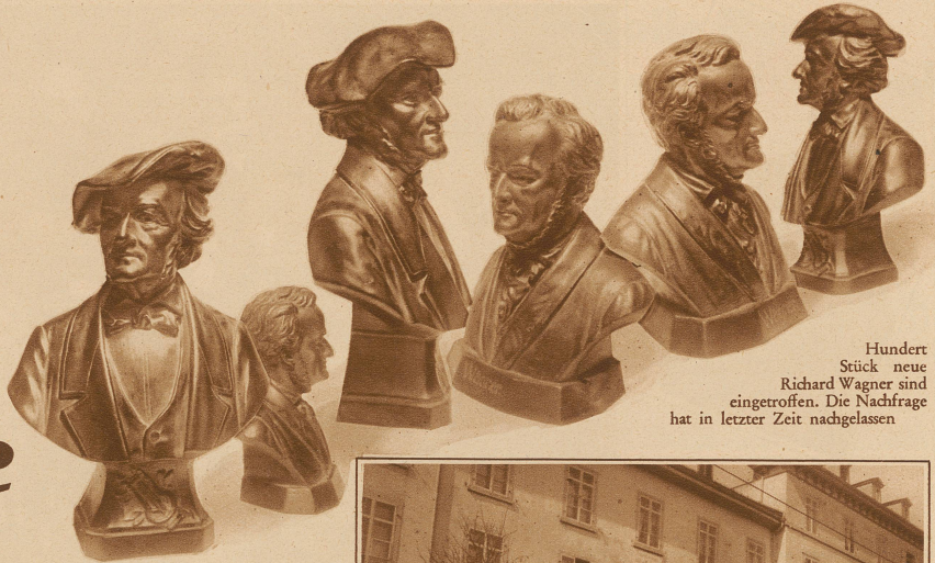
Hundert Stück neue Richard Wagner sind eingetroffen. Die Nachfrage hat in letzter Zeit nachgelassen

seien in Zürich, schrieb Richard Wagner einem Mitglied der Münchner Hofkapelle, als er die Symphoniekonzerte der allgemeinen Musikgesellschaft im großen Casino-Saale dirigierte. Das war vor 80 Jahren. Der Stolz jedes eingeleichteten Stadtzürchers bäumt sich gegen diesen Ausspruch des berühmten Komponisten auf, der als politischer Flüchtling steckbrieflich verfolgt, in Zürich wider sein Erwarten ein gastfreundliches Asyl fand. Hält er ihn aber dem leidenschaftlichen Musiker zugute, dessen götterstürmende Phantasie mit der Unzulänglichkeit des damaligen Musikbetriebs in Konflikt geraten mußte, dann kann er sich mit einer andern Briefstelle Wagners wieder versöhnen: «Die gewöhnlichsten Tanzmusiken hatte ich hier in Zürich zu Leistungen befähigt, von denen das Publikum und sie selbst keine Ahnung hatten.» Das Zürcher Material war nicht schlechter als in Dresden, Wagners früherem Wirkungsfeld, und unter dem be-