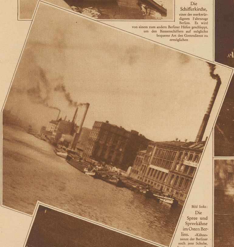
Bild links: Die Spree und Spreekähne im Osten Berlins. «Kähne» nennt der Berliner auch jene Schuhe, die eine etwas große Nummer haben