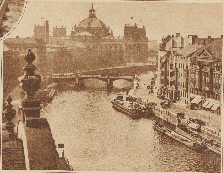
Der Schiffbauerdamm im Nebeldämmer; im Hintergrund das Reichstagsgebäude