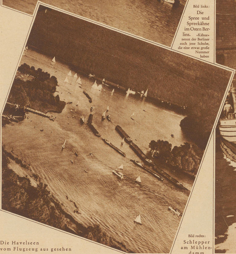
Die Havelseen vom Flugzeug aus gesehen