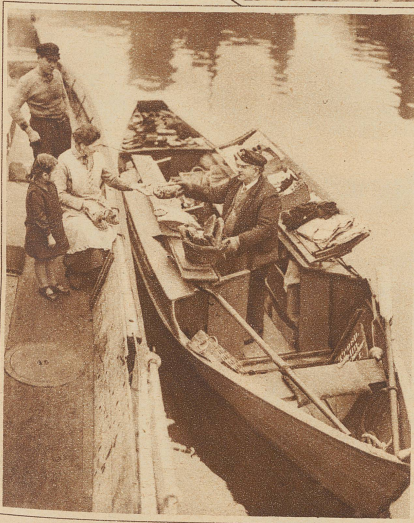
Das schwimmende Warenhaus.

Wer dürfte bei diesem Anblick an eine Binnenstadt. Würde man nicht eher glauben, eine Aufnahme aus einem Seehafen vor sich zu haben?