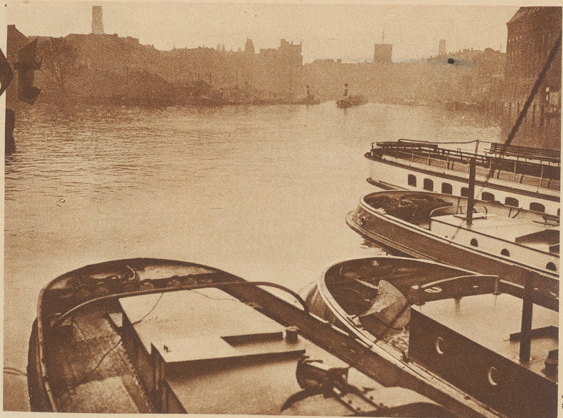
Stimmungsbild aus dem Herzen Berlins.

Um den in den Berliner Häfen lebenden Schiffleuten den Einkauf der notwendigsten Lebensmittel, Wäsche etc. möglichst bequem zu machen, kam ein Geschäftsmann auf die Idee, mit einem Kahn die Gewässer abzufahren und so seine Waren feilzubieten