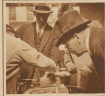
Der genaue Besucher