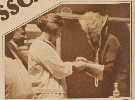
Nebstehend rechts: Die Mustermesse verschönt ihre Gäste: die meisten kommen mit polierten Nägeln nach Hause