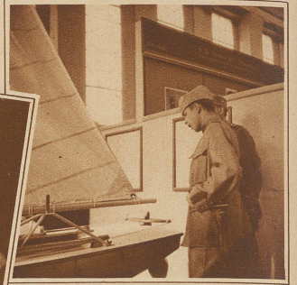
Bild links: Die Messe erfüllt ihren Zweck: Herstellung neuer Beziehungen zwischen Erzeuger und Verbraucher Die schweizerische Landmacht befaßt sich mit Schiffsfragen