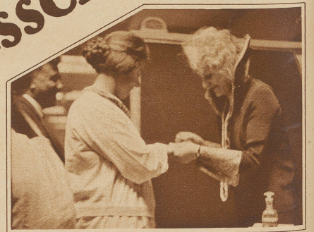
Nebstehend rechts: Die Mustermesse verschönt ihre Gäste: die meisten kommen mit polierten Nägeln nach Hause