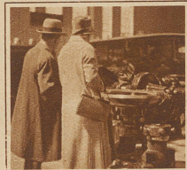
Gattin und Gatte in seellicher Uebereinstimmung vor den Werken der Technik

Die Schweizer Mustermesse in Basel ist ein wirtschaftl. Ereignis. Man kann dort vielerlei Erzeugnisse des menschlichen Fleißes und Erfindungsgeistes betrachten, aber man kann auch den Menschen selber beobachten, und zwar sieht man an der Mustermesse den aufmerksamen Menschen, so häufig und in so viel Arten, wie kaum bei einer andern Gelegenheit. Ich meine natürlich nicht nur oben in den Galerien, wo er mit Ernst die Käsküchli, den Wein, Schokolade usw. probiert, das gibt's auch anderswo zu sehen; nein, unten, in den Hallen, meine ich; da ist es wirklich erhebend, erfreulich, so viel gespannte Mienen zu betrachten, die da hinter die Besonderheiten der neuesten technischen Errungenschaften kommen möchten. Der Drang, diese Rätsel zu lösen, steht auf so vielen Gesichtern geschrieben, daß der Menschenfreund, der keine A.-G. und kein Fabrikationsgeschäft hat, sich doch auch über die Mustermesse freut, und darüber, daß er Aussichten hat, eines Tages einen solchen vollkommenen Zuschauer selber ausstellen zu können unter dem Titel: «Der Mustermensch an der Mustermesse.»