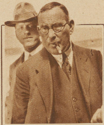
Der kritische Besucher