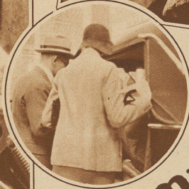
Bild im Kreis: Die Messe tut ihren Dienst: Sie macht die Gattin auf ein Schweizer Auto glustig