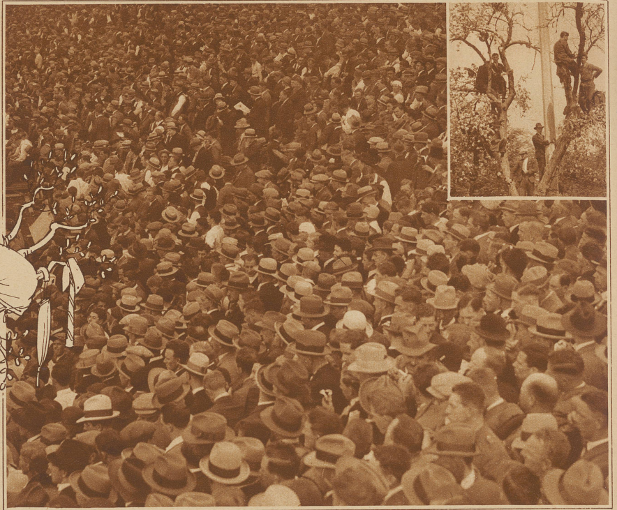
Glückliche Zuschauer, die zwar einen Platz bekamen, aber wenig Platz haben