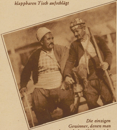
Die einzigen Gewinner, denen man aber auch das Glück ansieht