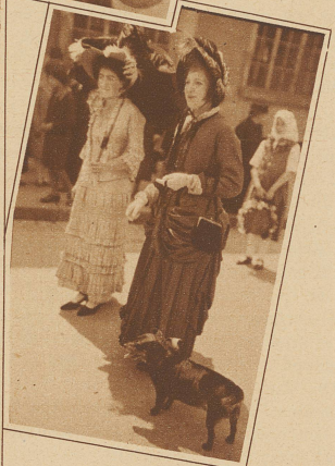
Vergangene Gestalten leben auf, die noch auf dem Lettensteig über die Limmat spazieren mußten