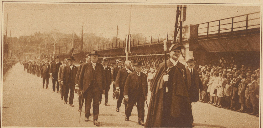
Der Einweihungszug auf der Lorrainebrücke in Bern. An der Spitze die bernische Regierung mit Bundesrat Minger in der Mitte