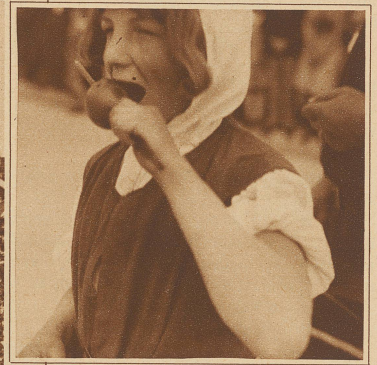
Die Sonne brennt heiß auf den Kinderzug nieder. Tells Knabe vergreift sich durstig an seinem berühmten Apfel