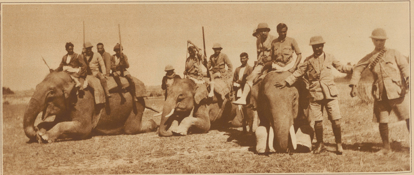
Das friedliche Indien. Aufbruch zur Tigerjagd. Als Transportmittel werden gezähmte Elefanten verwendet, die furchtlos durch dick und dünn gehen. Der hohen Kosten wegen ist die Jagd in Indien ein Privileg der reichen Leute

Der neue Standort des Denkmals am Hirschengraben