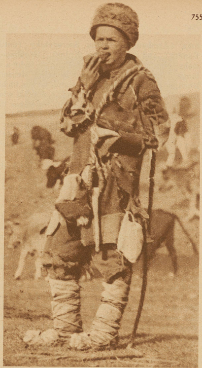
Bauernjunge aus den russischen Steppen