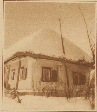
Bauernhaus in Sibirien mit Radioantenne zum Empfang der kommunistischen Propagandavorträge

wies den von den Adeligen an den Staat fallenden Großgrundbesitz den Bauern zu und zwar zu gleichen Teilen. 1917 begann also jeder Bauer unter ganz gleichen Verhältnissen mit dem Nachbar ein neues Leben unter der Fahne des kommunistischen Sowjetsternes. Dorfkulaken, also Dorfreiche, gab es nicht mehr seit diesem Zeitpunkt, denn alle waren infolge der allgemeinen, direkten und gleichen Teilung gleich «wohlhabend». Es gab seit diesem Zeitpunkt keine Betraki (Landarbeiter), keine Bjed-