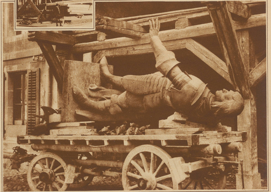
Adrian von Bubenbergs Ruhetage im Werkhof in Bern

Die Bundesstadt baut mit einem Kostenaufwand von etwa einer Million Franken den vor Bahnhof und Burgerspital liegenden Bubenberglplatz um. Damit mußte auch das Standbild des Helden von