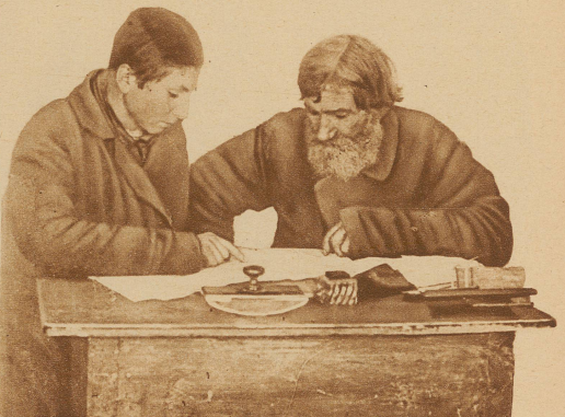
«Väterchen» wird durch seinen Enkel in die Geheimnisse des ABC eingeweiht, damit auch er der Segnungen des Kommunismus teilhaftig wird