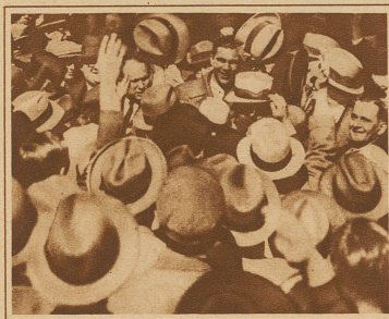
Bild rechts: Wie ein Held wird Schmeling von seinen Anhängern gefeiert