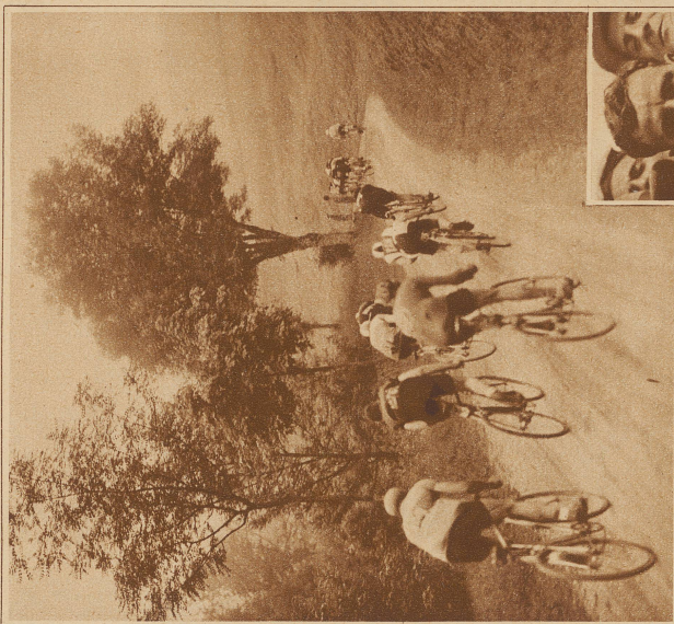
Die Kopfgruppe der Amateure unterwegs