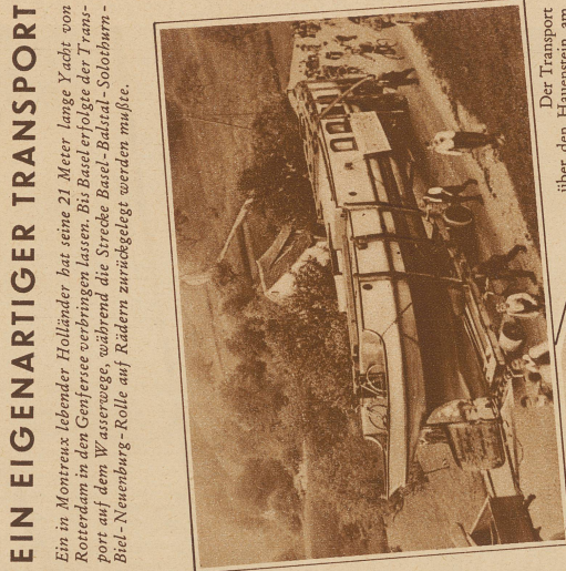
Der Transport des Hauensees über den Hauenstein am Donnerstag früh über Glirren