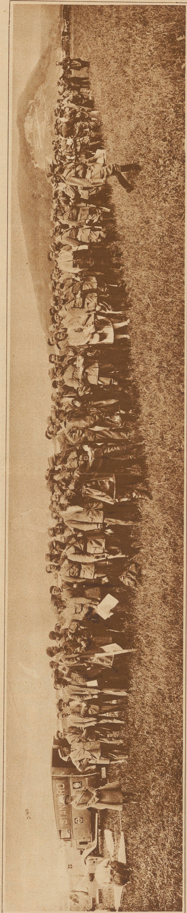
Die Teilnehmer (Flieger und Automobilisten) an der diesjährigen Basler «Avavia», die am Samstag bei einer Rekordbeteiligung von 22 Mannschaften einen vorzüglichen Verlauf nahm