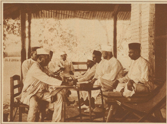
Das Fabrikbureau auf der Veranda im Schatten der Bäume. Eine wesentliche Eigenschaft des orientalischen Geschäfts ist die, daß es sich im Rahmen einer gemüthlichen Unterhaltung abspielt. Der Fremde hat das Gefühl, eher in einem Café als in einem Fabrikbureau zu sitzen