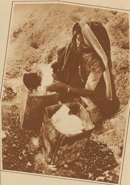
Eine Sortiererin. Ihre Aufgabe ist es, die Qualität der verschiedenen Lieferungen der Rohbaumwolle festzustellen