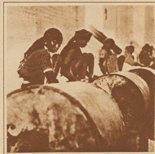
An den Reinigungsstrollern im Maschinenraum der Fabrik. Die Frauen hocken zur Arbeit, wie sie es von zu Hause her gewohnt sind