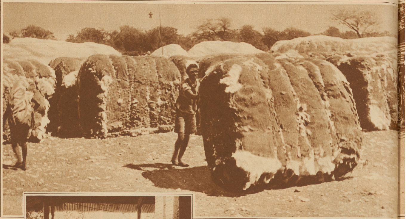
Das Lager der gereinigten und fertig gepressten Baumwollbällen