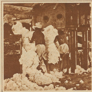
Mit einer hydraulischen Presse wird die Baumwolle zu Ballen gepreßt