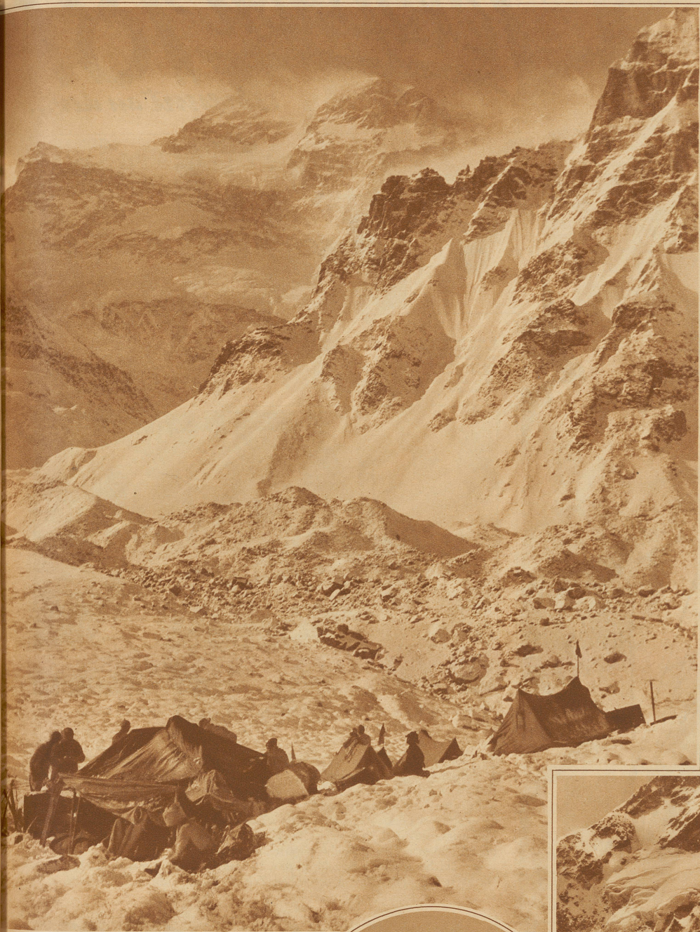
Ein Lager der Expedition in 6000 m Höhe. Im Hintergrund der jungfräuliche Gipfel des Kangchenjunga (8600 m)