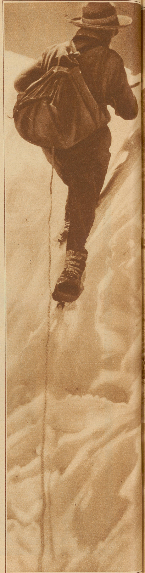
Nebenstehend rechts: Auf dem 6918 m hohen Gipfel des vollständig vereisten Dodang-Nyima

Ein eigenartiger Brauch hat sich in Malines (Frankreich) erhalten. Jedes Jahr an einem bestimmten Tag wäscht der dortige Erzbischof den 12 ärmsten Bürgern in der Kathedrale St. Rombaut die Füße und schenkt ihnen anschließend ein großes Brot und 5 Franken. — Das Bild zeigt Kardinal van Roey, Erzbischof von Malines bei der Fußwaschung