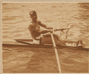
Ruderer, die sich mit großem Interesse die Arbeit ihrer Kameraden ansehen