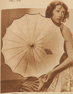
«Zeige mir deinen Sonnenschirm, und ich nenne deinen Namen»