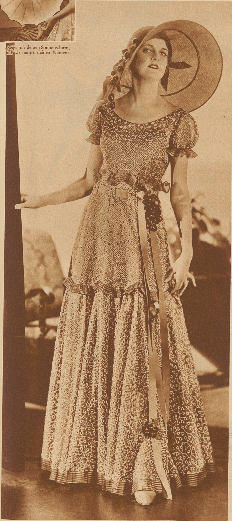
Bild links: Das ewig Weibliche bricht immer wieder durch! Modell aus besticktem Organdi