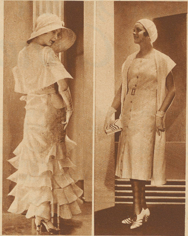
Einfach und doch so schick!

Ferien! Erlahmt da das Interesse für Mode? — Nur scheinbar. Oder bleiben in den Kurorten die schönen Kleider etwa unbeachtet? — Sie wecken den Neid der Nichtbesitzenden ebensogut, wie die kostbare Balltoilette der Wintersaison! * Jetzt wird es offenbar, welchen Modeströmungen sich die Frau angeschlossen, welche sie unbeachtet ließ. Mit welcher Sicherheit moderne Weiblichkeit gleichzeitig den größten modischen Gegensätzen huldigt! Sportlicher Einfachheit und malerischer Gewandung; der kleinen Stoffkappe und dem Wagenrad aus Stroh oder Rofshaar; sachlichen Dekors, wie dem Knopf, der das Waschseidenkleid schließt und Garnierung mit Spitzen und Bändern, mit Blumen und selbst mit Früchten, die wir in plastischer Nachbildung längst aus dem Bannkreis der Frauenmode ausgewiesen glaubten.