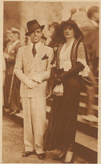
Neueste Eleganz: zum langen schwarzen Spitzenrock die schwarze Chiffonbluse