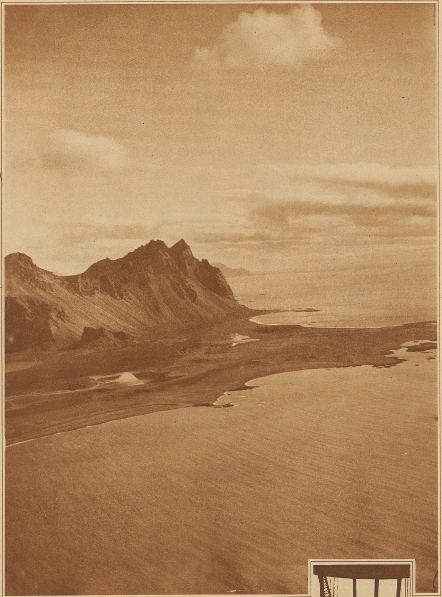
Das Vestrahorn an der Südostküste Islands