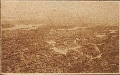
Fjordlandschaft bei Bergen (Norwegen)