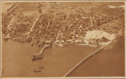
Islands Hauptstadt Reykjavik, deren Bewohner zum erstmal ein Luftschiff sahen. Die großen weißen Flächen sind Stockfischtrocknereien

Der einsame Laufgang im Innern des Luftschiffes. Diese Zeitaufnahme von mehreren Minuten auf der Fahrt zwischen Norwegen und Island aufgenommen, ist ein Dokument ganz eigener Art