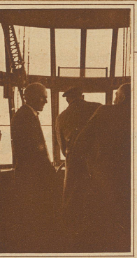
General Nobile als Fahrtteilnehmer im Navigationsraum. Mit welchen Gefühlen mag dieser Mann, der mit einem selbstgebauten kleinen Luftschiff zweimal über den Nordpol flog, heimgekehrt sein?