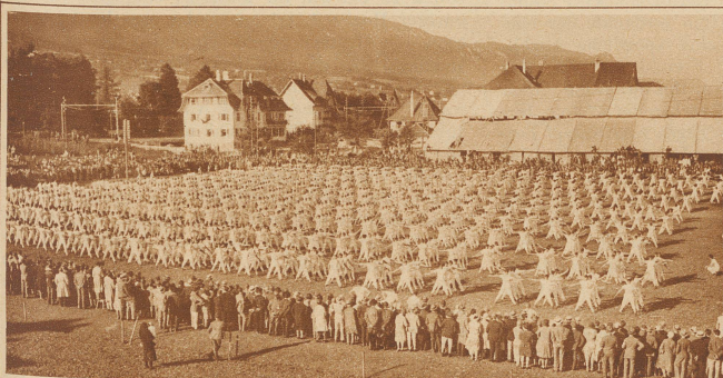
Die allgemeinen Uebungen