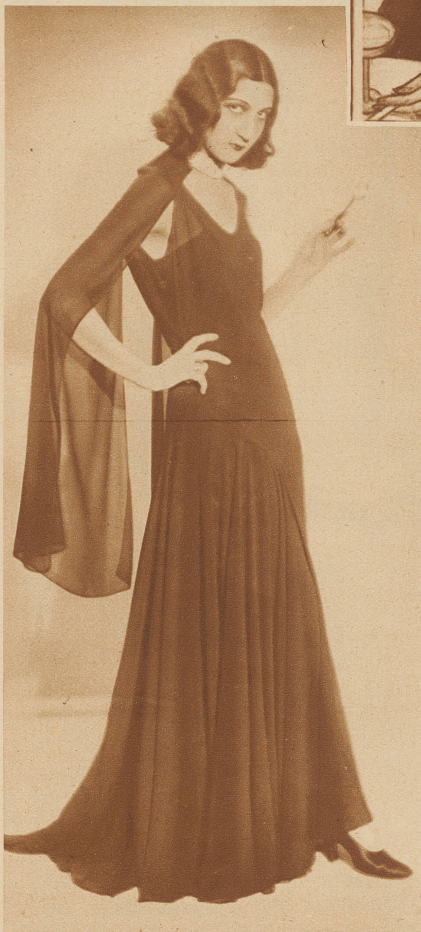
Flügel statt Ärmel