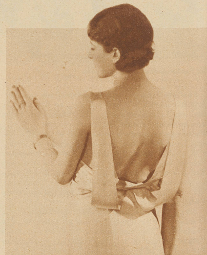
Frage: Wie hält der Herr die Dame beim Tanz?