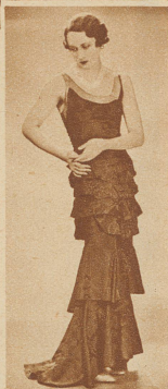
Die neue Silhouette

ten werden dürfen. Aber gleich im benachbarten Deauville herrscht Toilettenzwang. Da geht die Mode hochebenen Hauptes daher. Ein Bild rollt sich auf, so anmutig, pikant, phantasiereich, wie seit Jahren nicht. Denn einzigartig ist, was heuer an malerisch-künstlerischen Schöpfungen die Mode hervorgebracht. * Ein Rausch in Farben. Nicht endenwollende Mengen blendender, köstlich feiner Gewebe. Silhouetten, die phantastisch unwirklich, dennoch ausgesprochen damenhaft sind und seltsamerweise ihren Trägerinnen eine faszinierende Jugendlichkeit leihen. * Von fesselndem Reiz auch die vielen schönen Attribute der eleganten weiblichen Aufmachung. Die langen Handschuhe und die feinen Abendschuhe, die seltsam stilisierten Shawls und die entzückenden Handtaschen, die vielgestaltigen Puderbüchsen und routiniert geführte Lippenstifte, Schmuck, der betörend echt erscheint, ausgefallene Ketten, Armreifen und Ringe in Kristall und Imitationen, die oftmals den mehrfachen Wert echter Steine haben. * Ein Kapitel für sich die Verschiedenartigkeit von Materialkombinationen für Robe und Umhülle. Blendend schöne Ensembles, z. B. aus zartgetöntem Spitzenkleid bestehend und ein Capejäckchen aus dunklerem Panne. Immer wieder auch großgeblumte Gaze-Chiffon-Gedichte, die, trotz mancher Kritik, exotischen Pflanzen gleich in seltsamer Schönheit für sich werben. Dazu hauchdünne, einfarbige Paletots, die mit angeschnittener Echarpe in ihrem Gegensatz von strenger Form und