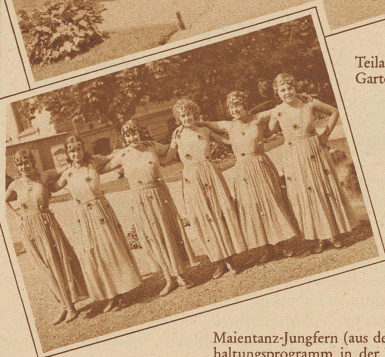
Maientanz-Jungfern (aus dem Unterhaltungsprogramm in der Festhütte)