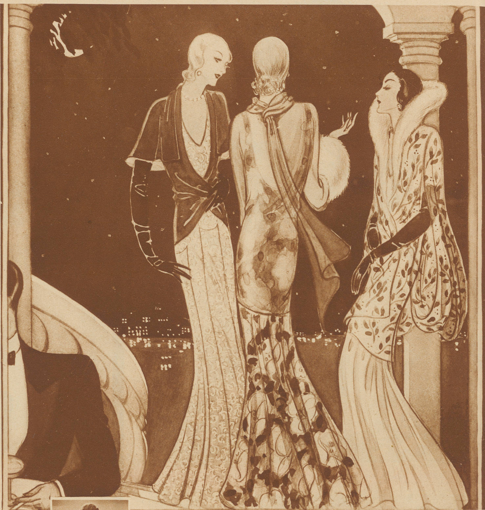
Vor dem Casino

In nervenaufreizender Monotonie überläßt der lockende Ruf der Croupiers das Gesumm in den Spielsälen. Schreiten, Flüstern, leises Klirren mischen sich mit Wolken der erdenklichsten Parfums zu prickelnder Atmosphäre. * In Ländern, die weniger auf moralische Geste ihrer Kursäle, als auf gute Einnahmequellen halten, bilden die «Casinos» den Brennpunkt sommerlichen Fremden- und mondänen Verkehrs. Wohl gibt es auch Casinos, die wie in Trouville mit allem ausgestattet sind, was der verwöhnte Gast an Spielsälen, Theater, elegantem Restaurant, Bar usw. erwarten darf und die dennoch auch im Reiseanzug betre-