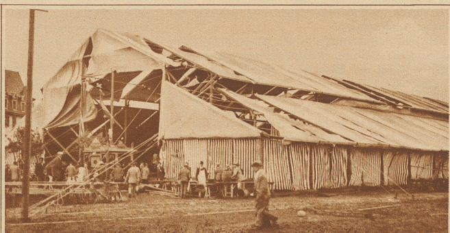
Der Sturmwind vom Samstag hat die Festhütte übel zugerichtet