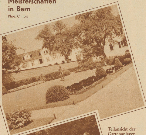
Teilansicht der Gartenanlagen