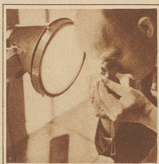
Juwelen werden durch besondere Fachleute untersucht

technischen Vorbereitung gelang es der unermüdlischen Arbeitsgruppe, alle wichtigen Begebenheiten des Mövenlebens in ausgezeichneter Weise auf das Filmband zu bannen und überdies eine Reihe prächtiger photographischer Aufnahmen zu machen, von denen die Bilder eine kleine Probe geben.