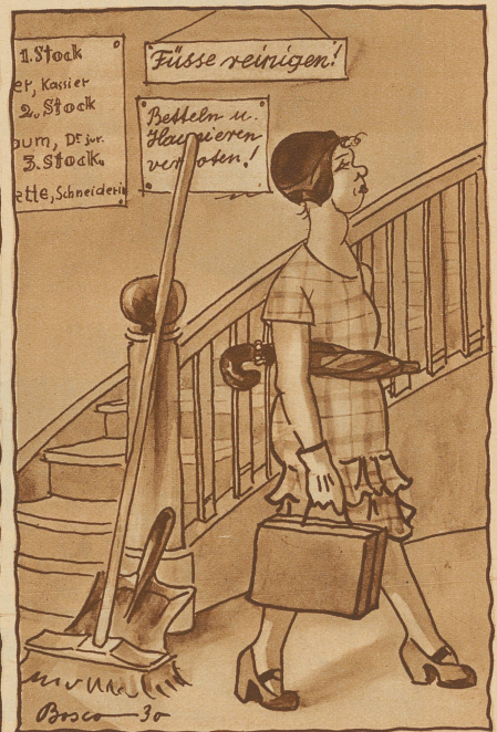
«Johanna geht und niemals «kehrt» sie wieder» (aus Jungfrau von Orleans) oder: Die «Perle» hat gekündigt

Wiener: «Ja, warum haben's denn das net glei g'sagt'!»