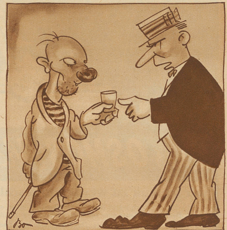
«Bedenken Sie, jedes Glas ist ein Nagel zu ihrem Sarg!» «Dänn geht min Sarg emal us wie n-en Igel.»