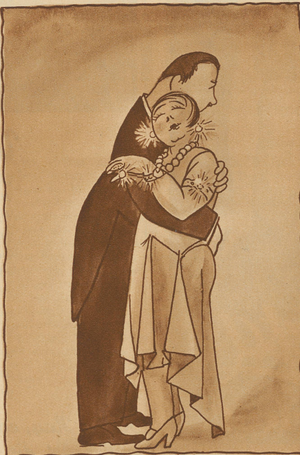
«Seid umschlungen Millionen» (Schiller) oder: «Die Verlobung»

Kunde: «Ich habe gemeint, Sie machen am Sabbat kein Geschäft.» Kleiderhändler: «Wie haist? Wenn ich Ihnen laß den Anzug für 90 Franke, mach ich da ä Geschäft!»